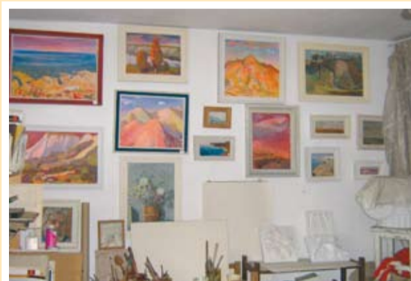
Ателието на художника

Редуват се длъжностите на младия специалист, основател е и първи уредник на Художествената галерия в Добрич, години наред е художник и уредник на в."Добруджанска трибуна", инспектор по изобразително изкуство в Окръжния съвет за култура, художник на кино "Добрич", но докато се сменят длъжностите през цялото време той е увлечен от работата, като ръководител на школи по изобразително изкуство. Близко четири десетилетия работи като педагог, очарован от поривите на няколко поколения - любопитни, любознателни