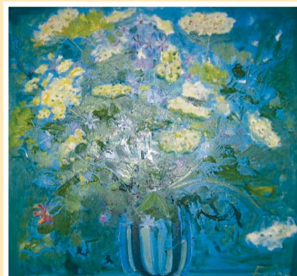
Цветя в синьо