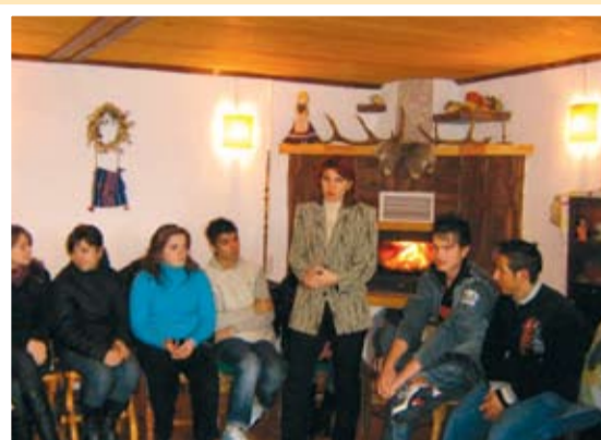
Лекции в чудесната битова къща