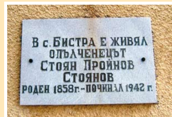
Паметната плоча в село Бистра