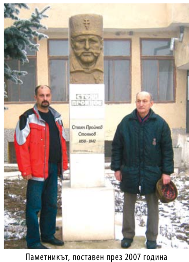
Паметникът, поставен през 2007 година