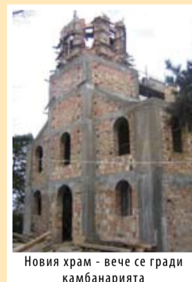
Новия храм - вече се гради камбанарията