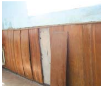
Коридор в СОУ, край който години наред минаваха децата

течачите, покрити с напукана смола покриви на детските градини; да правиш хиляди квадратни метри външна топлоизолация на сградите, за да е по-топло на малчуганите и очуканите падащи мазилки да останат само неприятен спомен. За предходните дванадесет месеца спечелихме общо 1 300 000 лева за саниране на училища и детски градини. 900 000 лева осигурихме като извървяхме трудния път на