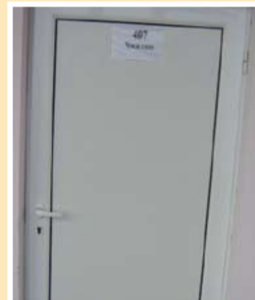
Новите врати придават много по-добър вид на класните стаи

подобряване на условията, в които растат и учат децата в общината. Инвестиции от този мащаб и характер водят след себе си допълнително още и трудови доходи за заетите в ремонтите, и повишаване обема на продажбите на специализираните в търговията със строителни материали фирми. В крайна сметка това прави стремежа на кметския екип да работи на високи скорости, тогава, когато става дума за общински проекти не само цел, а оправдано от гледна точка на ползите за обществеността усилие.