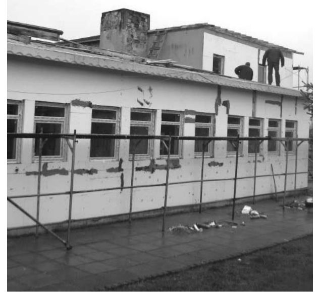
започна ремонтът на ЦДГ Здравец