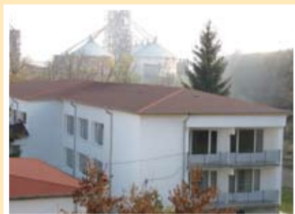
Новите покриви са сигурна защита и изолация за детската градина

„Ще продължи съвместната работа на общината с младежката неправителствена организация „Бъдещето е в нас“, като успешното партньорство в рамките на проект за изграждане на извънкласен център в с. Нова Камена бъде продължено с втори съвместен проект с младите хора.“