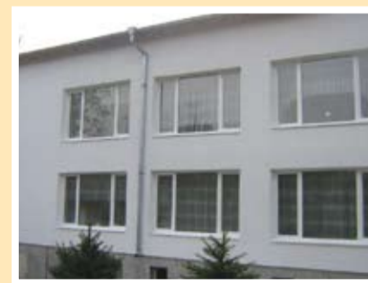
Същото място само 2 месеца след старта на спечеления общински проект

„Ще бъде използван натрупаният опит за работа с инфраструктурни проекти, за да се включи общината в програми, които финансират ремонт на междуселски общински и държавни пътища. С помощта на получените средства ще се ремонтират основно всички пътища в общината, които имат стопанско значение.“