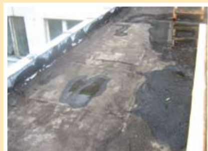
Покривът на ЦДГ 3 през последните десетина години не спираше изцяло дъжда

териториите на двете съседни общини – Тервел и Крушари. Оказа се, че всичко което предприехме в края на предходния мандат, за да положим основите на това мащабно, значимо и нелеко начинание е в пълно съответствие с изискванията за кандидатстване, обявени почти година по-късно. Така успяхме да продължим започнатото и сега вече