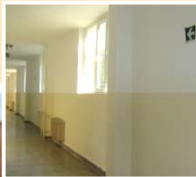
Същият коридор след ремонта

Тервел, обнови се изцяло парната инсталация на детската ясла, в момента с усилените темпове се санира ЦДГ „Здравец“, предстои да се ремонтира парната инсталация в ЦДГ „Детелина“ и да се изгради рампа на входа на детската ясла. Други 400 000 лв. „влязоха“ в общината по Програма за оптимизиране на училищната мрежа и се превърнаха в нови прозорци, врати, парни котли и мазилки в училищата. Така само за няколко месеца в общината се вляха суми, които представляват допълнителни 20 % над обичайния общински бюджет от около 6 000 000 лева годишно. И то вложени само за едно начинание – за