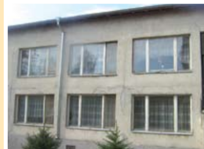
Така изглеждаше доскоро една от най-големите детски градини в Тервел

проектът, след реализацията на който двете общини трябва да имат легитимна и готова за работа Местна Инициативна Група /МИГ/ вече е преминала успешно няколко от различните оценки, на които са подложени всички проекти, с които се кандидатства пред европейските програми. Партньор на общината в този проект е младежката неправителствена