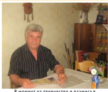
В момент на творчество и размисъл

В човешката история, в сложни времена-когато се рушат едни морални зидарии и се правят други, започнаха да се натрупват мнения, че да си честен, скромен, със собствено мнение е загубена работа, която нищо добро не носи на човека. Не им вярвайте! След шума на въртопите винаги идва време да се изчистят водите, да се отложи тинята и тогава онези