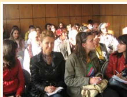
Среща в залата на читалището в с.Владимирово