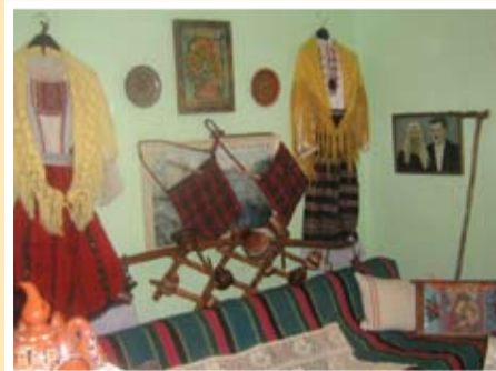
Мъничка част от семейните реликви в домът на Домакина