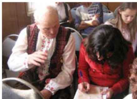
Разговор с един от самодейците

На срещата се завърза душевен разговор. Любезните домакини се