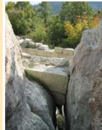
Специална награда за фотография

рождениците Ани на 6 години, Севда на 10 години, Ралица и Андреа на 8 години. Техните изпълнения-стихотворения, песни и танц бяха бурно аплодирани от приятелите на "Зодиак".