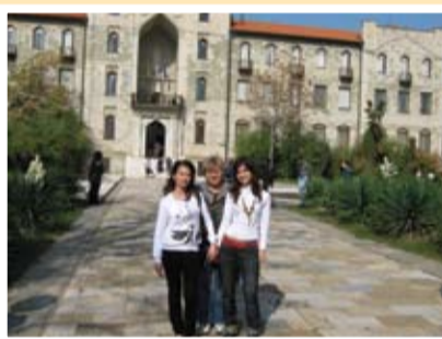
групата през Историческия музей

Вечерта приключи с тържествена вечеря и дискотека,