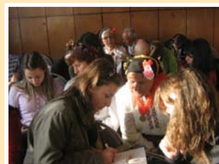
Среща в залата на читалището в с.Владимирово

надпреварваха да споделят за създаването на читалището, на танцовия състав, за множеството награди на събори. Най-много се гордееха от спечелените златни медали на Копривщица и за автентичните танци, които играят. Те споделиха, че Калчо-Ивановото хоро се играе само при тях и не си го дават на никого, но на "красивите деца", както се изразиха, ще го