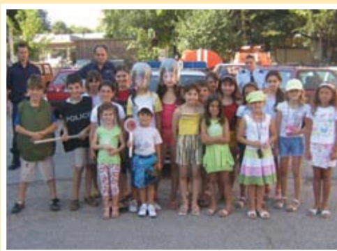
Научихме по нещо ново за професията- Полиция

Ден след проведеното по програма „Наше лято“ мероприятие със съдействието на полицаи от РПУ- гр. Тервел, посветено на безопасността на движението,