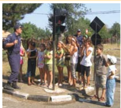
Светофарите и пешеходните пътеки са важни-ОУ село Безмер

Следващата част от срещата предизвика още по-голям интерес. В двора на РПУ децата се запознаха с оборудването на полицейските автомобили- радиостанция, полицейска сирена и др. Видяха и лично пробваха различни видове предпазни жилетки, каски, палки. Голям интерес и много шегички предизвикаха белезниците и преносимите радиостанции. За кратко време децата влязоха в ролята на полицаи, снабдени с