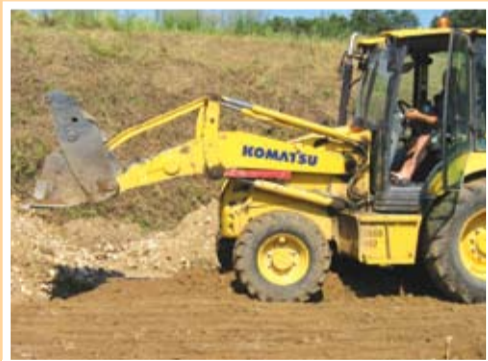
Ремонта на стадиона