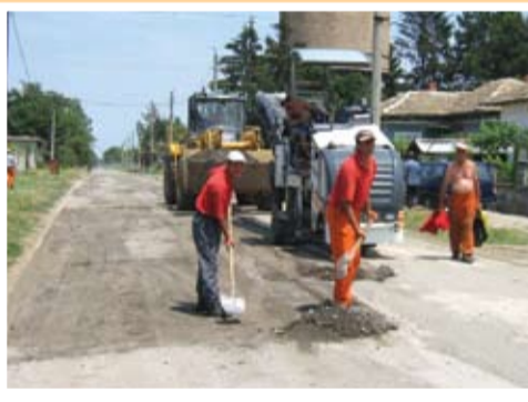
Улицата в Безмер