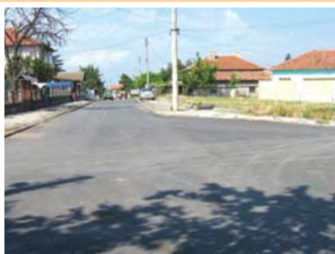
Новата настилка на Княз Борис и Камчия