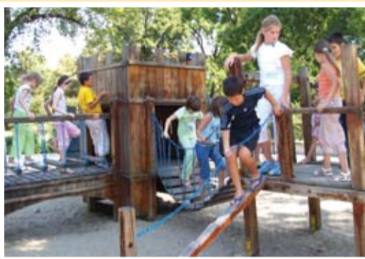
Наше лято – мозайка от слънце и приятели

от които някои страдат цял живот. А от друга страна противоположността, която предлагат летните организирани занимания – ако например се изработва карнавален костюм или маска – колко часа умът на детето е ангажиран да измисли как с подръчни материали да пресъздаде известен герой, към кого да се обърне за помощ, какво да направи само. Ако участва във