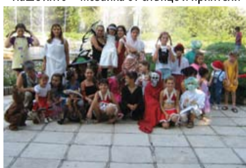
Наше лято – мозайка от слънце и приятели

Всички, които се интересуват от заниманията могат да получат диплома с графика на програмата за двата ваканционни месеца от общинския детски комплекс, който се помещава на третия етаж на музея (тел: 21-47) или от общината, стая 301 (тел: 20-85).