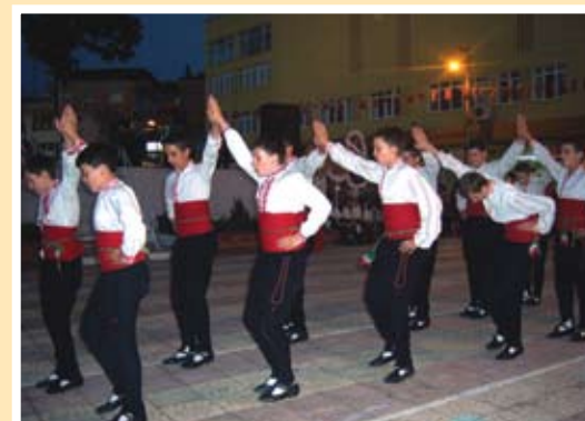
на сцената на фестивала в Турция