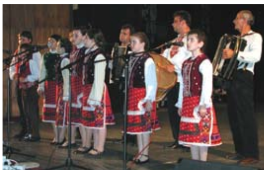
Школа за народно пеене