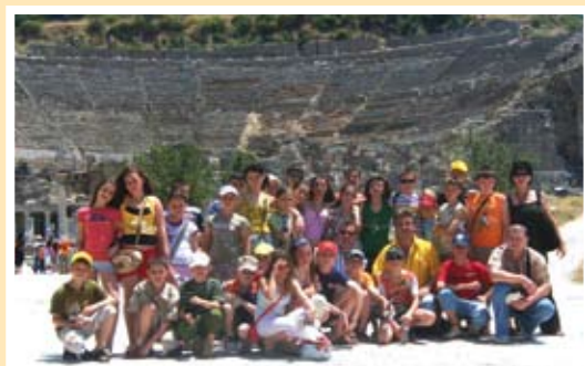
заслужен отход в южната съседка