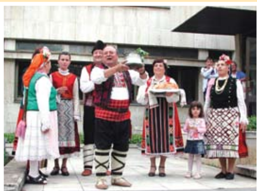
Ръководството на Общината посреща ръководителите през годините

Кратки разсъждения за българския феномен „Читалище“