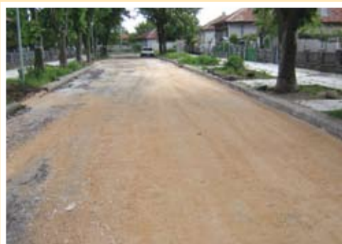
По време на ремонта

няколко: тя свързва североизточната част на града и най-многолюдния квартал „Изгрев“ с централната част на Тервел, представлява основна пешеходна зона за достъп до детска ясла, СОУ, административния и търговския център на града, пътната настилка е в изключително лошо състояние и на места уличното платно е непроходимо, улицата е дълга само 450 метра, тротоарите са в сравнително добро състояние и общината ще може да осигури завършен вид на улицата след ремонта като заплати за това сума в порядъка на около 100 000 лв. без ДДС, а това бе максималният бюджет, за който една община можеше да кандидатства по съответната схема за финансиране.