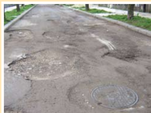
Доскоро разбитата улица

Тервелчани сигурно си спомнят събитията от миналото лято, когато на заседание на общински съвет дълго се дебатирало дали да бъде дадено съгласие общината да кандидатства пред Програма САПАРД с проект за ремонт на пътната настилка на улица „Св.Св.Кирил и Методий“ в Тервел или не. Доводите, които тогава бяха изтъкнати от кметския екип в полза на избора на тази улица бяха