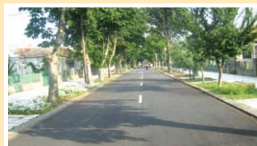
улицата след проекта по Програма САПАРД

В момента общината подготвя документите за усвояване на средствата.