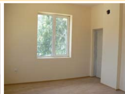
новият център няма нищо общо с рушащата се доскоро сграда