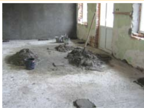
Така бе в началото ...