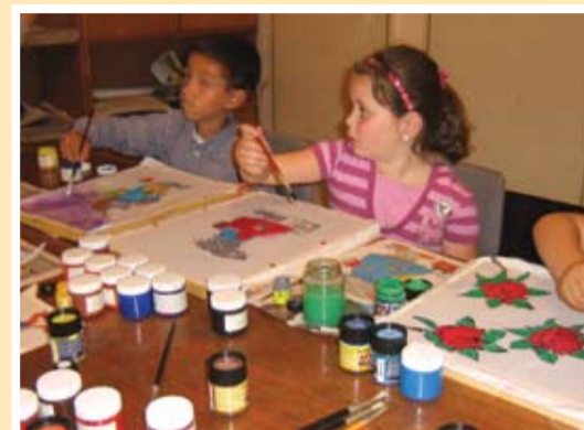
Рисуване върху коприна в с. Коларци

В началото на пролетта педагозите от ОДК започнаха да работят с деца от няколко училища извън Тервел. Най-активно в начинанието се включиха директорите и колективите на ОУ "Д-р Петър Берон" с. Коларци, ОУ "Паисий Хилендарски" с. Безмер и ОУ "В. Друмев" с. Орляк. Съвместната работа на педагозите от ОДК и колегите им в тези три училища вече даде резултати – детско шоу, посветено на пролетните празници и обичаи с децата от Коларци, изложба от кукли-лазарки, отново в Коларци, подготовка на тържество в с. Безмер, планове за хореография на танци в с. Орляк.... В края на м. май школата по приложно изкуство се измести за малко в училището в с. Коларци. Там децата усвоиха нова интересна за тях техника – рисуване с текстилни бои върху коприна. Произведенията се поставят върху дървени рамки и след броени дни ще красят стаите в училището. Плановите на педагозите вече са насочени към лятната ваканция и следващата учебна година. Хубаво е, че по времето, когато масово се закриват ОДК нашето в Тервел се запази и разшири дейността си. Това е най-доброто за децата в общината – да имат възможности да се учат и да се забавляват с помощта на своите учители.