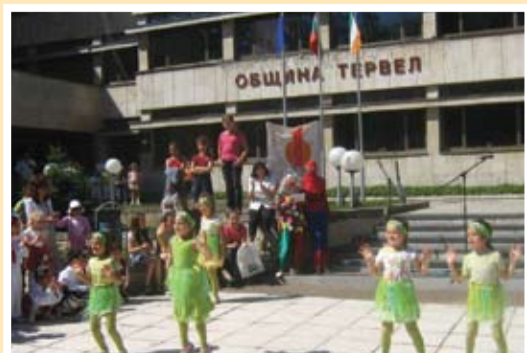
Жабките от ЦДГ “Детелина” град Тервел

Празникът започна с представянето на децата от ЦДГ “Любопитко” с.Божан и ЦДГ “Светулка” с.Коларци, които показаха народни танци и стихчета. След тях децата от ЦДГ “Детски свят” в с.П.Груево изиграха танц с помпони. А децата от ЦДГ “Здравец” с танца “Шаро и писанка” и от ЦДГ “Детелина” с танца “Веселите жабки” зарадваха всички