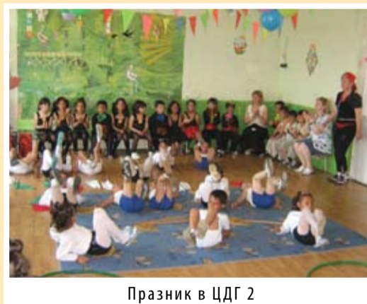
Празник в ЦДГ 2

Отново е пролет, отново грее слънцето и топли с лъчите си животни, птици и хора. Отново разцъфтяват цветята и лястовичките се завръщат по родните гнезда, защото най-хубаво е у дома. Те идват тук- под стряхата на нашата прекрасна детска градина “Първи юни”. Тук мирише на гора, пеят авлиги, катерички скачат по дърветата, но най-хубавия звук са звънливите детски гласчета, които чуруликат също като птичките. Тук всеки ден е възшебен и за това, че на тържеството на 29 юни децата слушаха една необикновена история. Слушайте...!