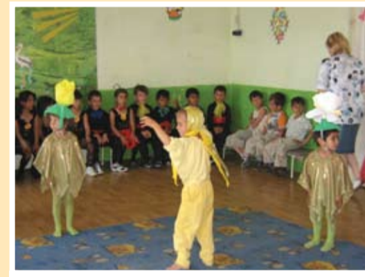
Природни сили - ЦДГ 2

Палечка пристига в Европа. Само на крилите на детската мисъл и фантазии можеш да обходиш всички континенти и държави. Така нашите деца видяха красотата на света, разбраха, че всички деца на земното кълбо са като тях – смели в мечтите си и толкова си приличат. Всички народи си имат свои характерни танци и песни. Чухме английски песни, гледахме поредица от италиански, испански и унгарски танци.