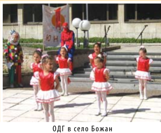
ОДГ в село Божан

присъстващи. На сцената се изви една красива “Плетеница” от народни ритми, изпълнена от децата на ЦДГ “Първи юни”. Малките певци- “Биберони” към читалището изпълниха с настроение своята песничка.