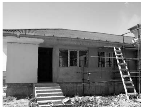
Корпус „Б“ на Дома за стари хора

• Приключва изпълнението на първия етап от проекта за изграждане на дома за стари хора. Направен е грубият строеж на новия блок Б, преустроен е от съществуващата сграда на бившата детска градина блок А. Поставен е санитарния фаянс в блок А. Предстои боядисването му. След окончателното приключване на етапа, общината ще подготви втори проект за довършителните дейности и оборудване на социалното заведение, с който ще кандидатства по Програмата за развитие на селските райони. Нейното отваряне се очаква в периода 15-20 юли т.г.