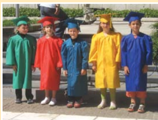
абитуриентите с тоги

“Здравейте, здравейте, мили деца. Честит празник!” – така Спайдърмен и Палячо поздравиха децата от всички детски градини на общината, които участваха в общоградското тържество в чест на Празника на детето- Първи юни.