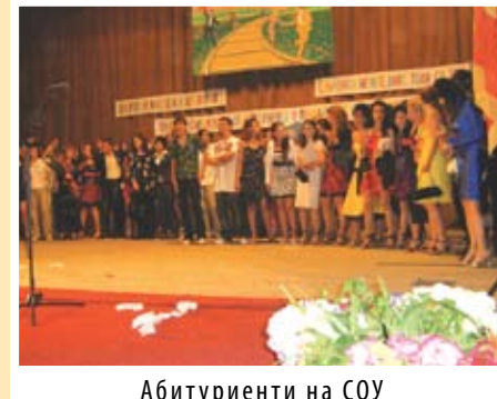
Абитуриенти на СОУ

В самия ден на 24 май на площада пред общината се проведе общоградско тържество с програма от ФТА