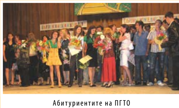
Абитуриентите на ПГТО

В този прекрасен ден целия град излезе в центъра на града да се нагледа на хубостта на абитуриентите, да ги изпрати към тяхната първа бална вечер.