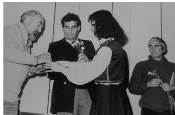
гост на „Дъга“ в Тервел

Обича гр. Тервел, гостува и е почетен член на клуб „Дъга“.