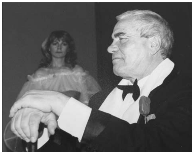
д-р Ранк в „Нора“ на Ибсен