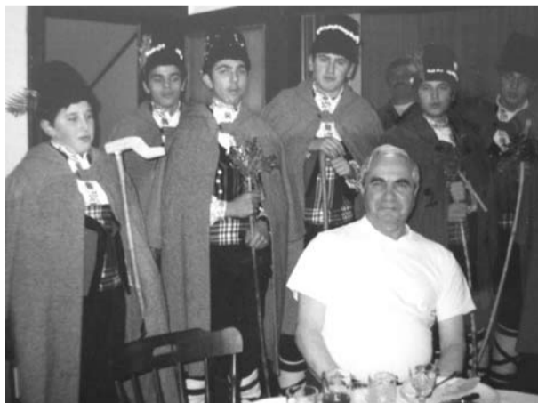
с коледаи от Тервел

Работил е в Държавния сатиричен театър, а от 1976 год. до своето пенсиониране работи в трупата на театър „София“. Сцената е безпощадна, тя взема и дава. Запрестоя си в Държавния сатиричен театър актьорът споделя „... в Сатиричния театър, където няколко души правеха това, което им харесва. Същите те бяха уволнили не кого да е, а режисьора Методи Андонов. Уви, за мен това бяха три безсмислени години. Едва когато постъпих в театър „София“ – със сравнително най- свободен репертоар, с ярки режисьорски и актьорски дарования и активни творчески връзки с другите изкуства, разбрах разликата между столичната и в другите градове атмосфера. Духовният живот беше различен и ангажиментите ми в киното по-лесно осъществени. Но, в мен остана една постоянна носталгия към Варна, приятелите ми, към морето, което беше често пред очите ми“.