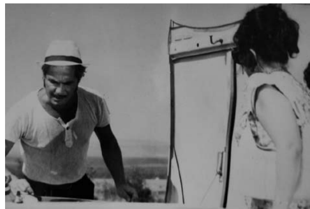
във филма „Баш майстора“

Нямаше лесен живот, изкарваше годините без особени материални възможности. Но винаги с гордо вдигната глава!“