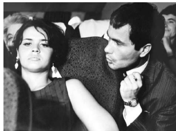
във филма „Шведски крале“

А житейската философия на Кирил Господинов, споделена в едно интервю звучи така: „Да направя добро дело, да се боря срещу злото. Особено сега, когато животът ни е съпътстван от престъпления, които ме отвращават, ужасяват, разстройват ме. Или, ако не успея да направя добрина на другите, то аз самия да се съхраня добър и справедлив. Към това се стремя!“