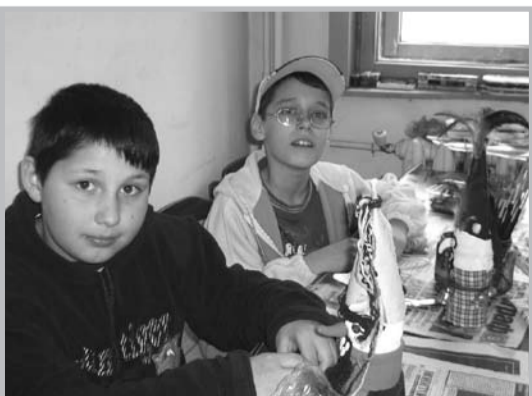
Майсторите на кукери от ОДК