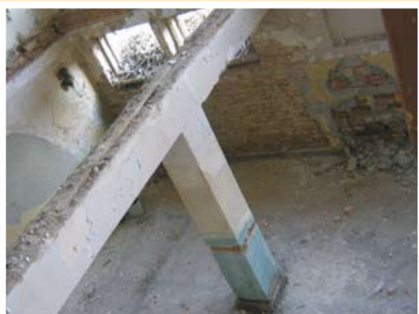
Квалификационният център преди ремонта

Целта на настоящия материал не е да цитира сухи цифри и термини, а да Ви запознае с основните моменти от бюджета на общината, с новите законови положения, с които е съобразено съставянето му и в крайна сметка да Ви даде представа как този бюджет ще се отрази на живота в нашата община. Даваме си сметка, че едва ли гражданите се интересуват от бюджетните параграфи и подпараграфи. Всички обаче се вълнуваме от това каква храна получават децата в детската градина, ще има ли празници за тях, ще се ремонтират ли още улици, ще се облагородяват ли места за отдих и спорт, ще има ли финансова криза в училищата при провеждане на реформата в общинското средно образование, ще се ремонтират ли обществени сгради, ще се запълнят ли дупките по общинските пътища, ще станат ли готови скоро църквата и старческият дом, ще има ли концерти за малки и големи, ще се реализират ли спечелени проекти, ще се отделят ли средства за нови и още безброй други неща, които общината трябва да свърши със средствата от този бюджет. Затова тук ще се опитаме да се спрем най-общо на тези въпроси.