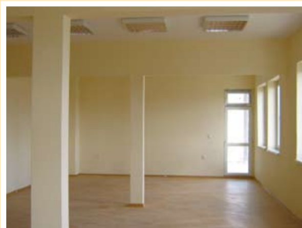
Квалификационният център след ремонта

се явяват безвъзмездно финансиране, което завишава цитираната по-горе сума. Приходната част се формира от събраните данъци, продаденото недвижимо и движимо общинско имущество, получените от държавата трансфери за част от дейностите в училищата, читалищата, детските градини, ремонтите и зимното поддържане на пътищата. От събрани данъци за т.г. се очакват 373 045 лв., а от продажби - 1 160 091 лв. От субсидии от Републиканския бюджет се очакват други 4 554 250 лв.