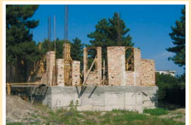
Първите стъпки при строежа на храма

Като проблем за бюджет 2008 г. се очертава недостигът на местни приходи, което ще затрудни поемането на разходи за горива за детските градини, детска ясла и останалите бюджетни звена през последните месеци на 2008 г. По тази причина общината толерира сключването на договори с доставчици, които предлагат по-дълги срокове за разплащане на закупените количества и по този начин разплащанията се извършват в началото на следващата (в случая 2009) година.