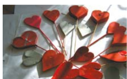
Малките късчета любов, които децата ще подарят

За следващите срещи, които ще се организират в консултативния кабинет се предвижда изработване на картички и мартенички, които на 1 март ще бъдат подарени на деца и възрастни със специални потребности. Тази инициатива е с тригодишна традиция. Децата, които посещават занятията със старание и любов създават своите „малки послания“, за да подарят усмивка и надежда, за да подарят късче чудо и усещане. Усещане за топлина и сръдечност, от които винаги се нуждаем, но най-са ни скъпи по празниците.