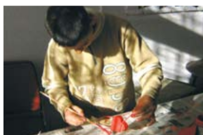
Възпитаник на Консултативния кабинет се старее над своето сърчице

Функциониращият към Местната комисия за БППМН консултативен кабинет продължава работата си в посока превенция и контрол на рисковото поведение сред подрастващите. Осъществяването на контакт с децата и родителите, потърсили помощ при решаване на проблеми, свързани с поведението на малолетните и непълнолетните, отново е основна задача на екипа, работещ в консултативния кабинет. Акцент в дейността на кабинета отново е превенцията по отношение на проблемите, свързани с асоциалните прояви на подрастващите. Наред с предвидените през годината тематични и актуални беседи и лекции ще се проведат и приятни групови занимания, осмислящи свободното време, както и индивидуални консултации с деца и родители.