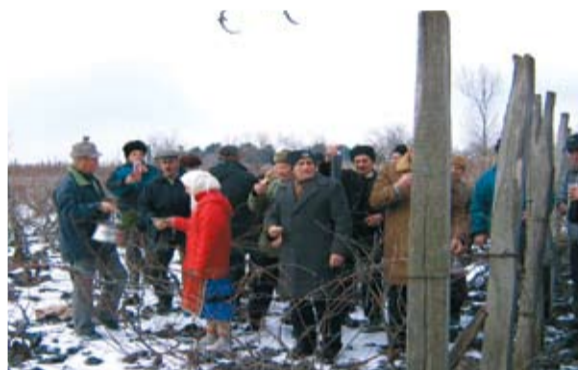
Трифон Зарезан в село Кладенци - 14.02.2007 г.

На този ден във всяко лозе има хора, защото се счита, че ако не се отреже поне един „чукан“ от лозето, то няма да даде обилен плод.