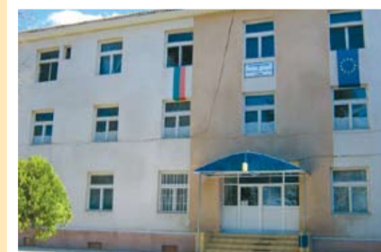
Болницата в гр. Тервел

време се е удавил вълк и за това селището е наречено така.