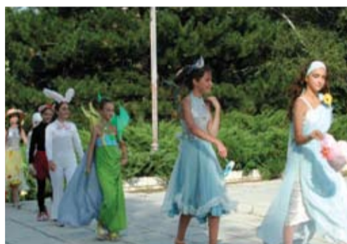
Общинска програма "Наше лято"