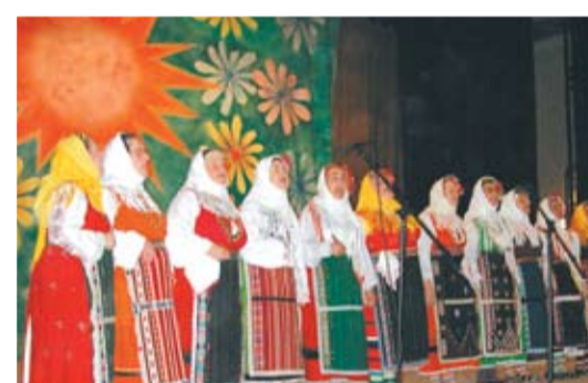
Съборът в Тервел вече почти 50 години събира любителите на фолклора от региона