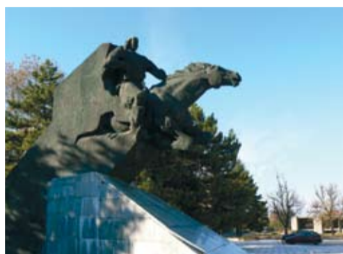
Памятникът на Хан Тервел

5. Сферата , в която работя е свързана с образованието и проблемите на децата и младежите и нямам достатъчно наблюдения върху бизнеса в града . Затруднявам се да правя преценка за перспективите за развитието му.