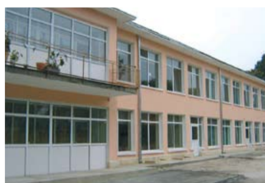
Най-старата детска градина в гр. Тервел

Обстоятелството, че Тервел и Тервелския край лежи в географския център на Южна Добруджа, по средата на пътя между Черно море и Дунав, е влияло твърде силно върху съдбата му. За известен период от време е част от територията на черноморските градове, друг път принадлежи на дунавските, а в трети случаи на първите български столици Плиска и Преслав. Но той винаги е представлявал един малък, относително самостоятелен район, чийто център се е променял с издигането на едни или други селища в неговите граници.