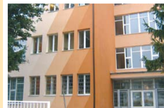
СОУ "Йордан Йовков" гр. Тервел

Първи сведения за Тервел като селище намираме в турски документи, достигнали до нас от 1673 година. В тях за първи път се среща името Куртбунар /Тервел/, което, преведено означава „вълчи кладенец“. Според една от легендите в един от многото кладенци по това