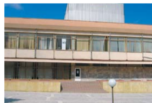
Читалището на града