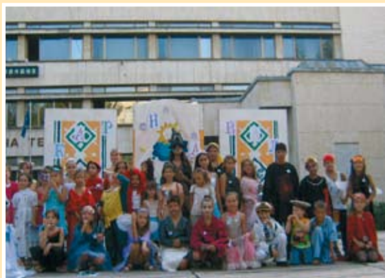
Карнавално преоблечени сме всички

Да усещаш, поне за малко че си някой друг, всъщност е едно екстремално усещане. Ти чуваш само ударите на сърцето си, виждаш стотиците весели и греещи очи- тези на публиката, която в такт с музиката те окуражава и очите на останалите участници- на онези- преобразените... Ти усещаш само това- огромна радост, щастие, ентузиазъм и още... По оваците на публиката усещаш, че си е заслужавало да изработиш с помощта на мама и тати своят костюм, оценяваш няколкото безсънни вечери и целият положителен заряд, които ти носи твоето участие.