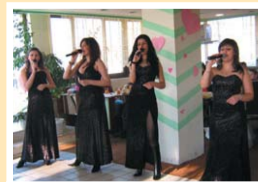
Ай дълките от Добрич гостуват на тервелските младежи