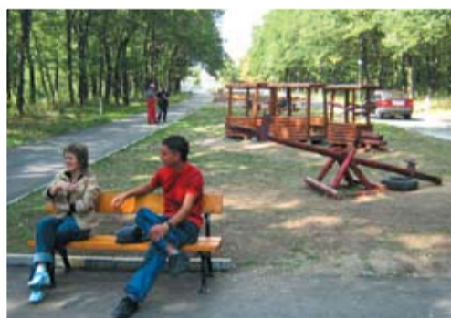
Градският парк след ремонта