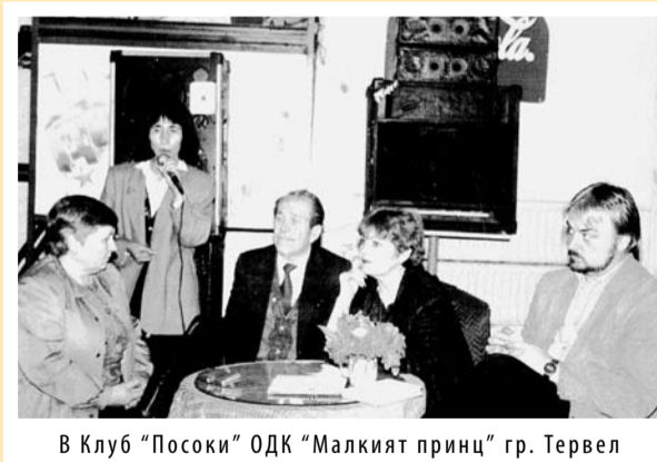
В Клуб "Посоки" ОДК "Малкият принц" гр. Тервел