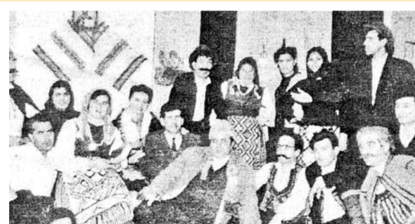
Театрален състав, постановка "Боряна" на Тервелска сцена през 1986 и 2006 г.