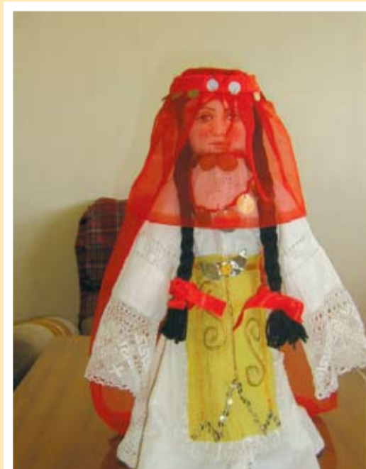
Тиха - ЦДГ село Коларци

Така се наричаше проведения през седмицата конкурс посветен на героините в творчеството на Йовков. За тях е писано и говорено много, не едно и две деца са писали или заучавали съчинения за женските образи в йовковите произведения. Не едно и две деца са се старали да ги пресъздадат върху белия лист по време на конкурсни изпити и олимпиади. Малко или много обаче техните разсъждения са повтаряли заучени фрази от литературни анализи и мисли, които са изречени от някой друг.