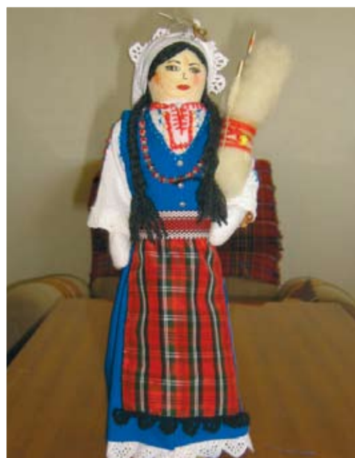
Женда от Постолови воденици