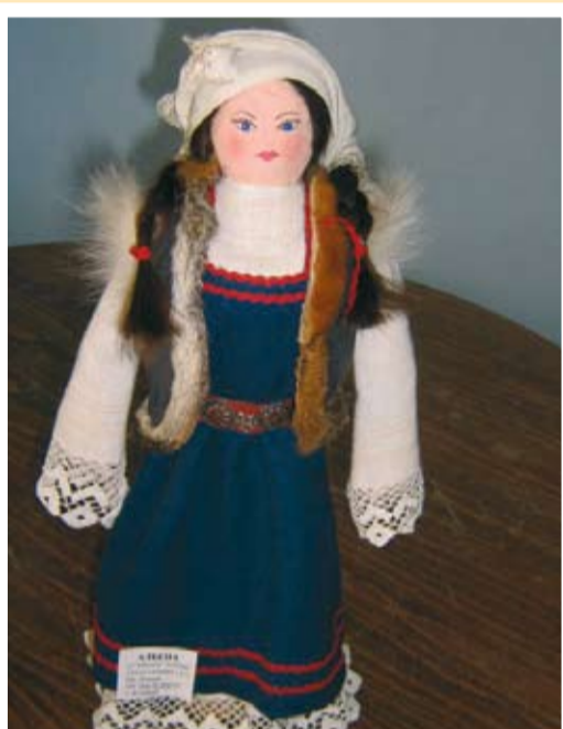
Албена - Основно училище село Коларци