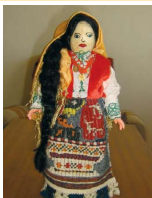
Рада - ЦДГ село Нова Камена