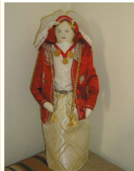
Василена от Сватбата на Василена

Ние, организаторите от община Тервел благодарим на всички участници за красотата, която сътвориха, за желанието им да се отзовават на всички инициативи, за любовта и търпението към децата, с които работят. Радваме се, че имаме възможност да бъдем партньори на прекрасни хора – педагози, родители, деца и младежи.