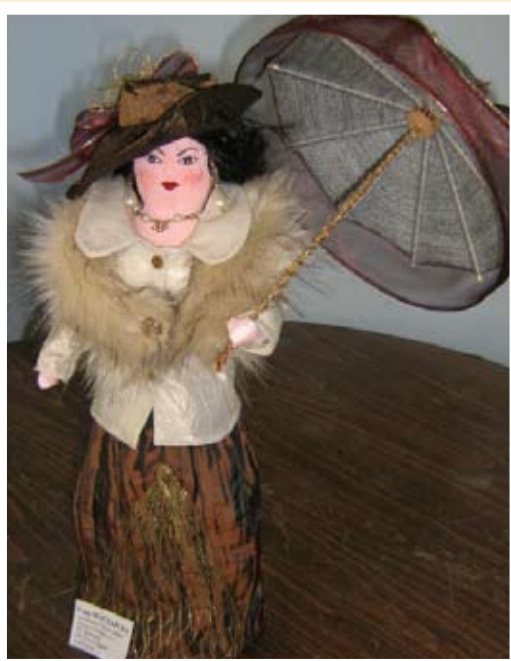
Госпожа Масларска „Милионерът“