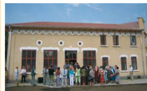
Обновената Филипова кръчма