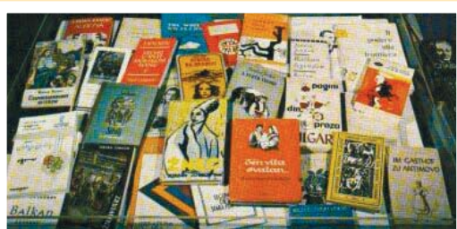
Една малка част от огромното наследство, оставил ни завинаги Йовков ...

Красивата сграда на дом-паметник „Й. Йовков“, съчетание на българските възрожденски традиции с модерното архитектурно мислене, е гостоприемна среда за адекватно представяне живота и творческото дело на писателя. И през третото хилядолетие Йовковите белетристични текстове очакват своите проникновени читатели и тълкуватели.