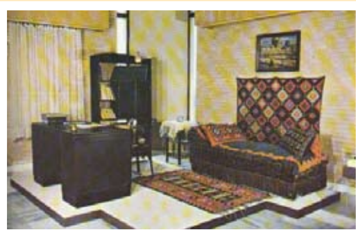
Кабинетът на Йордан Йовков

На 21 ноември 2007 год. се навършват 127- години от рождението на писателя. В Община Тервел се създаде традиция на този ден да се посвещават интересни инициативи, насочени към най-младите. През миналата 2006 година деца и ученици от Тервел и селата участваха в конкурс за драматизации по разкази на Йовков- „Рада, Божура, Сали Яшар – мозайка от етноси в творчеството на Йордан Йовков“. Младите актьори пресъздадоха на сцената известни йовкови герои и така неусетно и за самите тях се „приближиха“ до творчеството на писателя. Тази година се организира конкурс за изработване на кукли по женски образи от негови произведения под мотото „Жената в творчеството на Йовков- сила и нежност, красота и грях“.