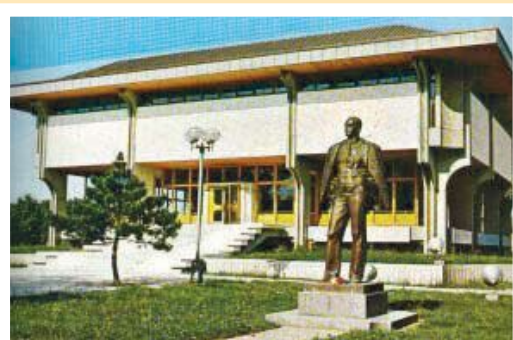
Дом-паметник "Йордан Йовков" град Добрич