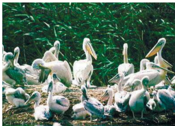
Рядко срещания къдроглав пеликан по бреговете на езерото

Резерватът "Сребърна" е защитен от българските закони още от 1948 г. През 1975 г. Сребърна