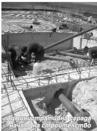
Административна сграда - начало на строителство