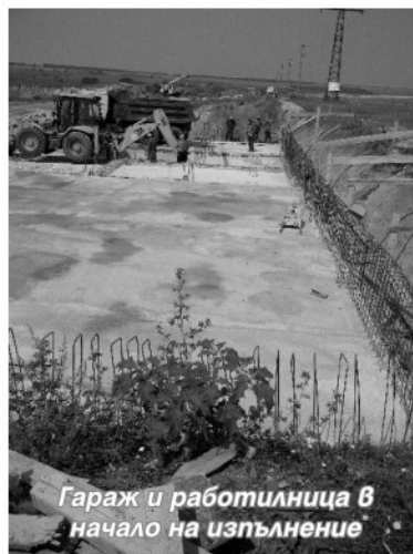
Гараж и работилница в начало на изпълнение