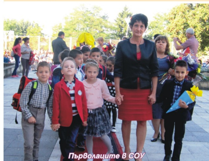
Първолаците в СОУ