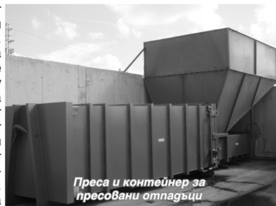
Преса и контейнер за пресовани отпадъци