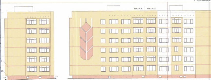
Фасада Блок 7