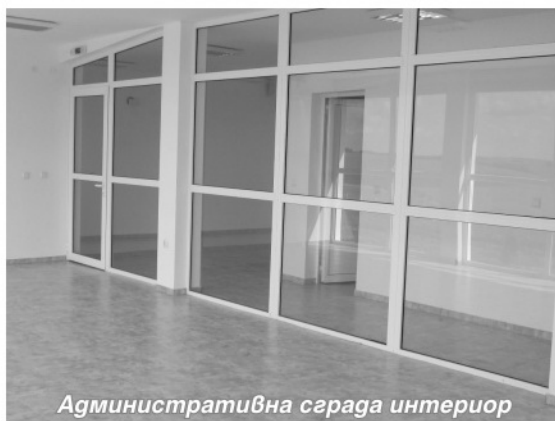
Административна сграда интериор