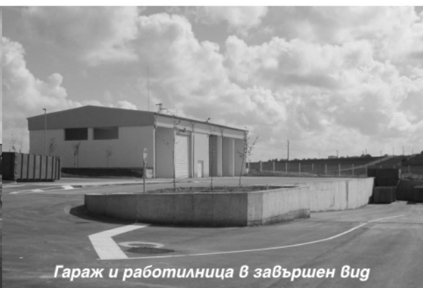
Гараж и работилница в завършен вид