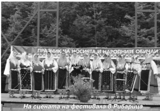
На сцената на фестивала в Рибарица