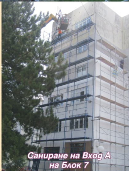
Санирание на Вход А на Блок 7

дограмата, после ще се демонтира старата покривна конструкция и ще се полага нова. Паралелно с това ще се прави външната топлоизолация. За цокъла на блоковете е предвидена топлоизолация и измазване с цветна структурирана мазилка. И за двата блока, последни по ред ще бъдат работите по входовете и стълбищата. Целта е да се