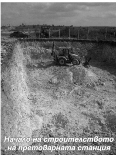
Начало на строителството на претоварната станция