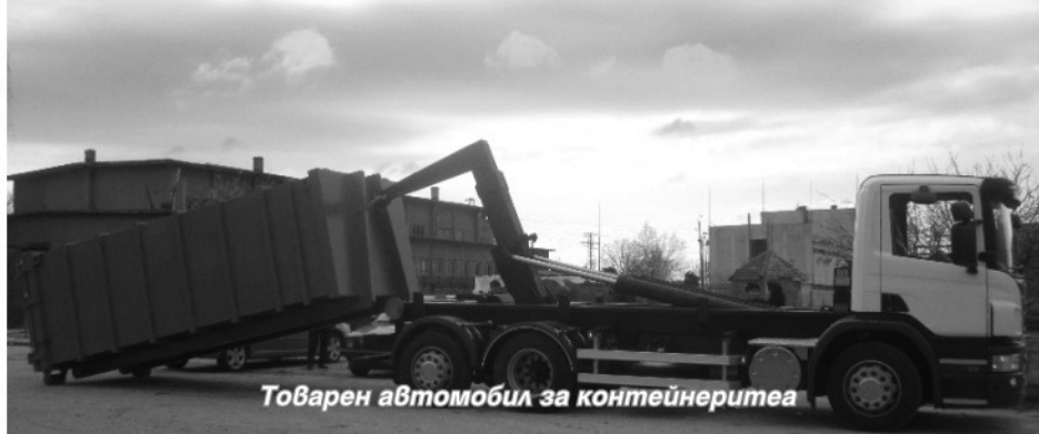
Товарен автомобил за контейнерите

на 2 323 197 лв. без ДДС. От тях 329 000 лв. са разходвани за оборудването, а останалите за строителство на площадка, сгради, съоръжения и