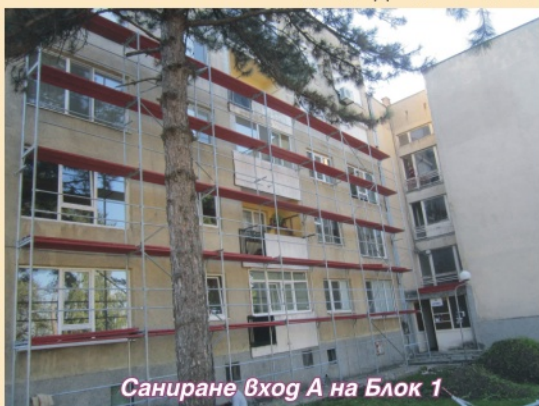
Санирание вход А на Блок 1

Прави се топло и хидро изолацията на покрива. След приключване на работите по Вход "А", скелето ще бъде изместено за работа по Блок "Б". Преди да започнат строителните работи, общината предложи на собствениците на двата блока за съгласуване проекти на фасадите. Всеки собственик на жилище имаше възможност да провери начинът, по който ще се оформят терасите и прозорците му, както и да изкаже мнение за цветовото оформление. След като вече е в ход строителството по Блок 7, на 17 септември започна монтаж на скелето и смяна на дограмата и на Блок 1. И за този