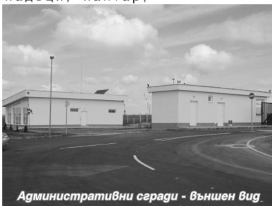
Административни сгради - външен вид