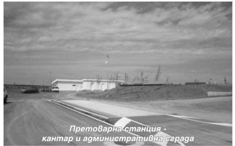
Претоварна станция - кантар и административна сграда

В понеделник, 31 август бе осигурено хранене с е л е н е р г и я за новоизградената претоварна станция за битови отпадъци в гр.Тервел. Започнаха изпитания на всички машини съоръжения и инсталации. Изпитват се в работни условия : преса за битови отпадъци, електронна везна за товарни автомобили, помпена група за резервоар за противопожарни нужди, дизел-генератор, районно осветление, машини за отоплително-вентилационна система на сградите , всички изградени инсталации и др.