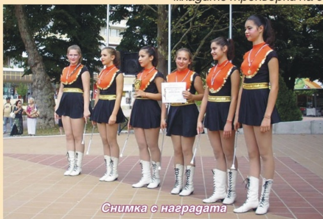
Снимка с наградата

Мажоретките от Тервел отново спечелиха най-големия приз на фестивала "Златен помпон", в който се състезаваха девет състава от България, Румъния и Словакия. Постиженията в мажоретния танц на момичетата от добруджанския