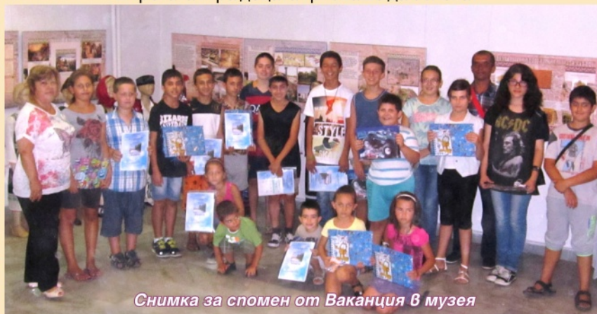
Снимка за спомен от Ваканция в музея