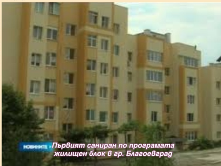
Първият саниран по програмата жилищен блок в гр. Благоевград

Общинското ръководство храни надежда, че добрият пример на собствениците на жилища в първите два блока, подкрепен от бързите действия на Община Тервел, ще има положително влияние върху собствениците на останалите 5 сгради в Тервел, които са допустими за включване в програмата за енергийна ефективност на многофамилни