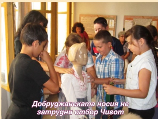
Добруджанската носия не затрудни отбор Чигот