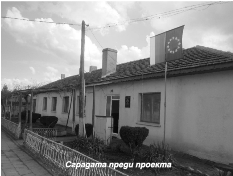
Сградата преди проекта