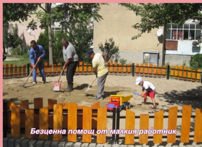
Безценна помощ от малкия работник

В сутрешните часове на 25 август работна група от Община Тервел започна да запълва с пясък пясъчника на новата детска площадка в квартала. Възрастните обаче нямаше да успеят да се справят със задачата без ценната помощ на малчуган с кофичка и камионче. "Младежът" усърдно се потруди, за да разстеле новия пясък.