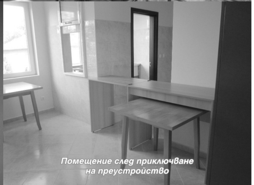
Помещение след приключване на преустройството