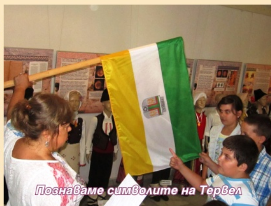
Познаваме символите на Тервел