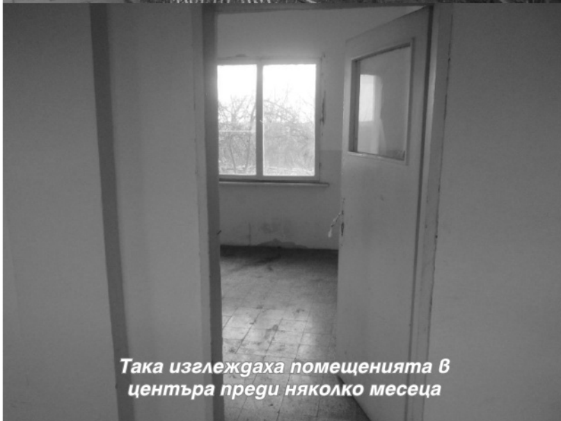
Така изглеждаха помещенията в центъра преди няколко месеца