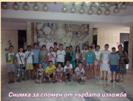
Снимка за спомен от първата изложба