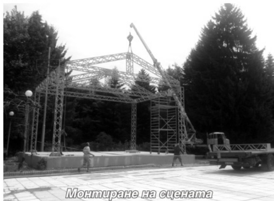
Монтиране на сцената

съоръжения за игра на деца в кв. Изгрев - стара част. До момента в тази част на квартала имаше спортна площадка за големи деца, но малчуганите нямаха свое кътче за игра. Посредством финансиране от ПУДООС се доставиха и монтираха общо шест тематични съоръжения. Със собствени средства общината възстановява градинки и пясъчник в междублоковото пространство, където бяха монтирани съоръженията. Стойността на детските съоръжения е 4 885 лв. без ДДС.