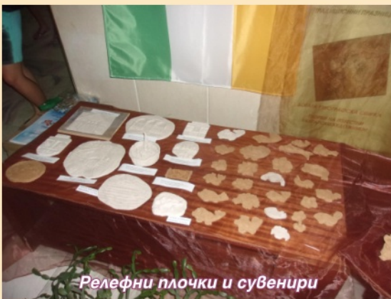
Релефни плочки и сувенири

ученици са 39, разделени в 3 групи по 13 деца от първи до 7 клас. Въпреки трудоемката работа, децата от начало до край са много запалени и очакват с интерес новите за тях предизвикателства. В началото всички