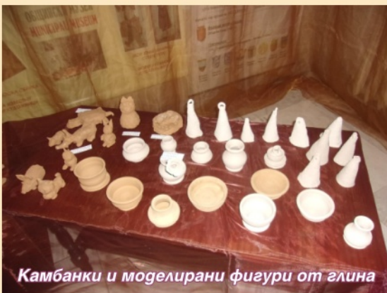
Камбанки и моделирани фигури от глина

предмета, който ще изработват, а след това стъпка по стъпка изпод малките им ръчички и злизат произведения със собствени стил и визия - едно с едно няма еднакви. Пристъпва се към специална