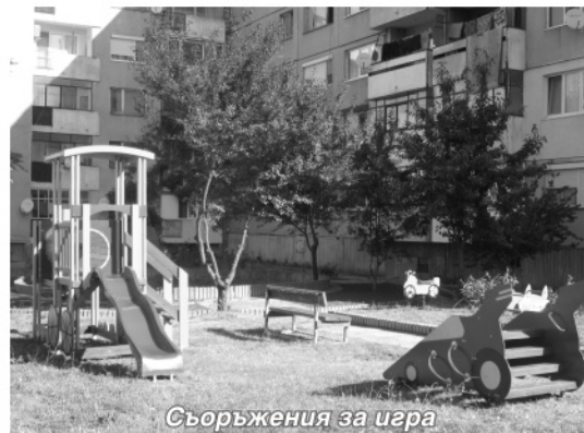
Съоръжения за игра