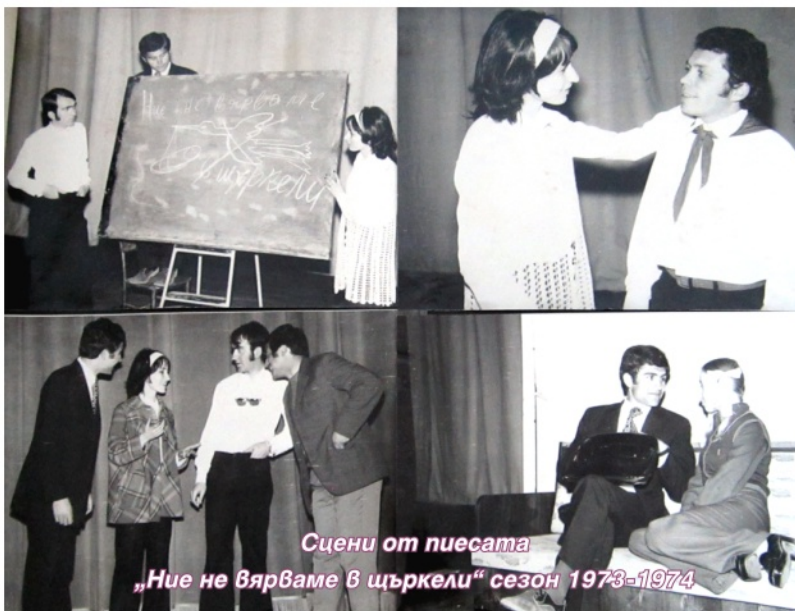
Сцени от пиесата „Ние не вярваме в църкели“ сезон 1973-1974