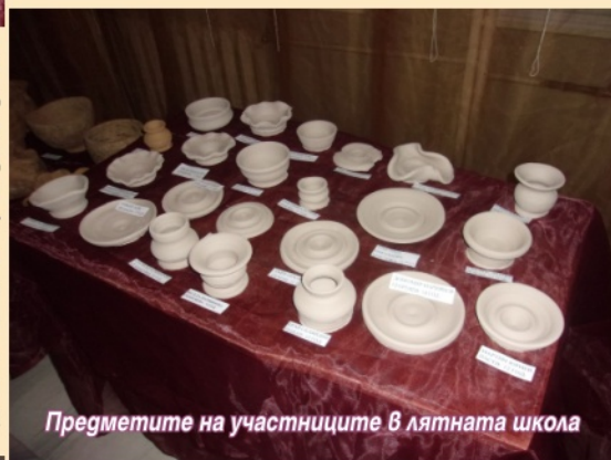
Предметите на участниците в лятната школа