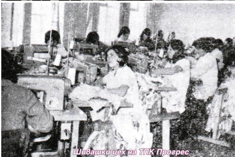
Шивашки цех на ТПК Прогрес

Началното училище "Н. Вапцаров", - базово за АПК, предстои да бъдат