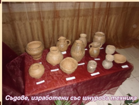
Съдове, изработени със шнурова техника