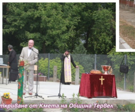
Откриване от Кмета на Община Тервел