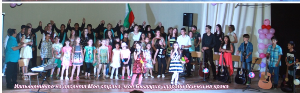
Изпълнението на песента Моя страна, моя България изправи всички на крака