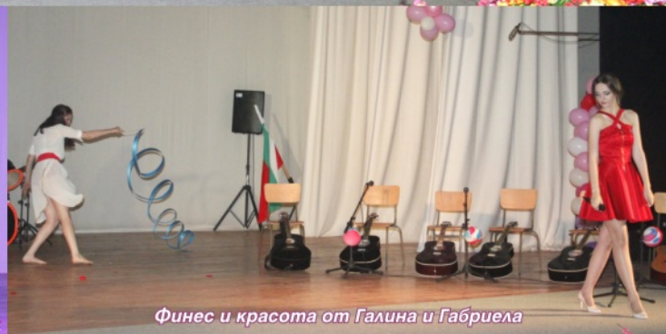
Финес и красота от Галина и Габриела