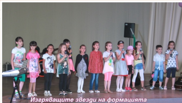
Изгряващите звезди на формацията