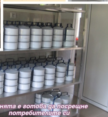
Кухнята е готова да посрещне потребителите си

Скъпи гости на откриването на Центъра бяха домащите в дома за стари хора в с.Полковник