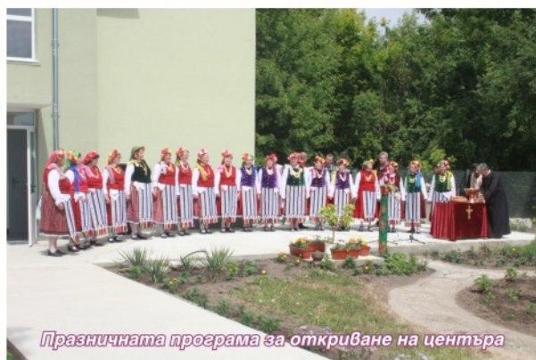
Празничната програма за откриване на центъра

Крайният резултат е : кухня - майка , оборудвана с пълен набор професионална кухненска техника и оборудване, хладилни и фризерни съоръжения, складове за всички видове и групи продукти: лек автомобил