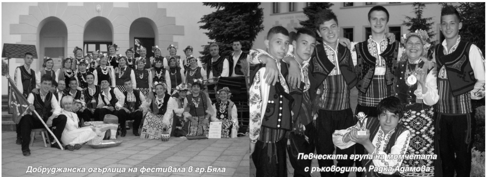
Добруджанска огърлица на фестивала в гр.Бяла

голямо присъствие на събора - 40 участника. Веднага след завръщането си певците и певиците украсиха с присъствието си празника за откриването на центъра за социални услуги в с.Нова Камена.Изявата на читалищните самодейци в гр.Бяла стана възможна чрез финансовата подкрепа на Община Тервел, която