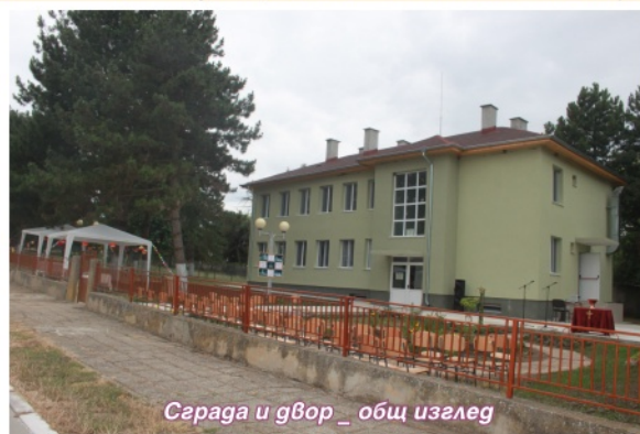
Сграда и двор _ общ изглед

по Програма за развитие на селските райони по Подход ЛИДЕР, т.е чрез финансиране на проектите по стратегията за местно развитие на МИГ Тервел-Крушари. Общата стойност на финансирането от МИГ е 140 000 лв. и включва инвестиции в строителство, кухненско оборудване и обзавеждане и закупуване на нов автомобил за разнос на