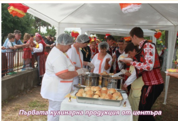
Първата кулинарна продукция от центъра