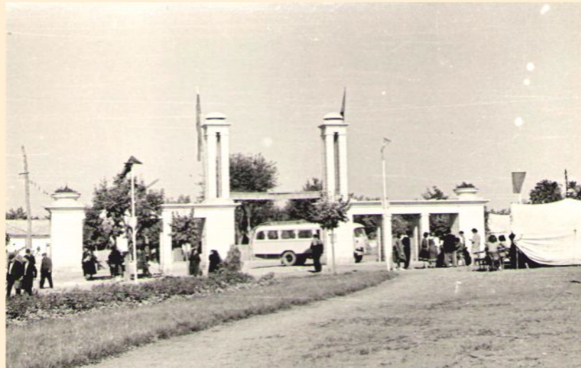
Порталът на градския парк посреща участниците в Добруджанския събор

училища, читалища, детски градини – това са темите, които са вълнували съгражданите ни преди 55 години, същите теми вълнуват общността и днес. И така, след като вече знаете какви събития, цели и личности са движили обществения живот през 1960 г., очаквайте от следващия брой на вестника рубриката "Представяме Ви: Тервел през годините...", в която ще Ви разкажем (отново чрез извадки от старите документи и вестници) за живота в града през периода 1961 - 1979 година.