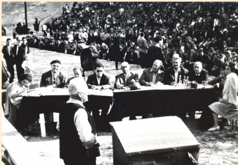
Изпълнител с част от журито на Добруджанския събор през 1960 г

документация. Направени са постъпки за отпускане на лимитни средства (целени средства за капиталови разходи от държавния бюджет), ще се набират дарения от гражданите. Предвижда се през 1961 г. да бъде завършена сградата на стадиона в Тервел, обособени са терени за спортни игрища в с. Войниково, с. Кочмар, с. П. Савово, спортни площадки по волейбол и баскетбол в гр. Тервел. Програмата предвижда строителството на двуетажни къщи в центъра и някои централни улици. За целта