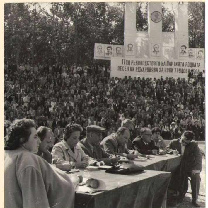
Журието на Добруджански събор през 1960 година

И ето, днес отваряме съкровищницата с архива на община Тервел. Разглеждайки хилядите документи лист по лист, едва сега правим равностметка за делото на хората, свързали съдбата си с идеята да живеят и работят в Тервел и да направят възможното той да получи облика на