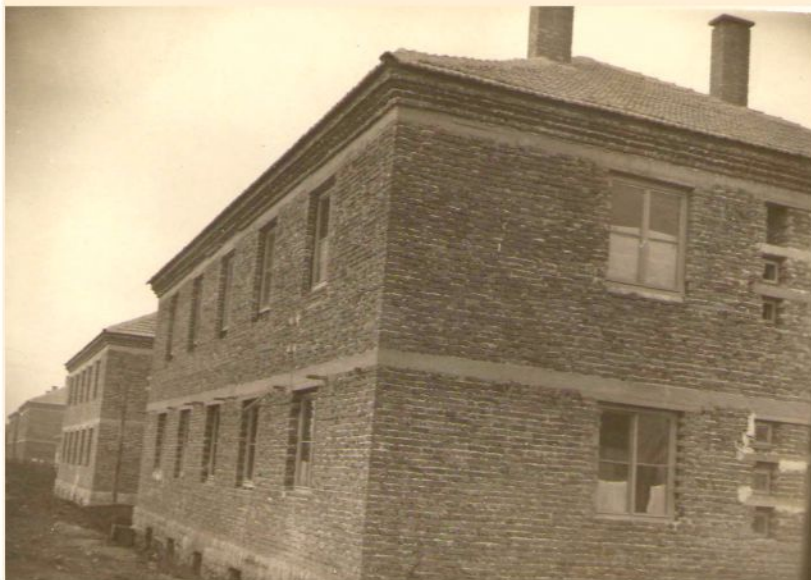
Строежът на старите блокове