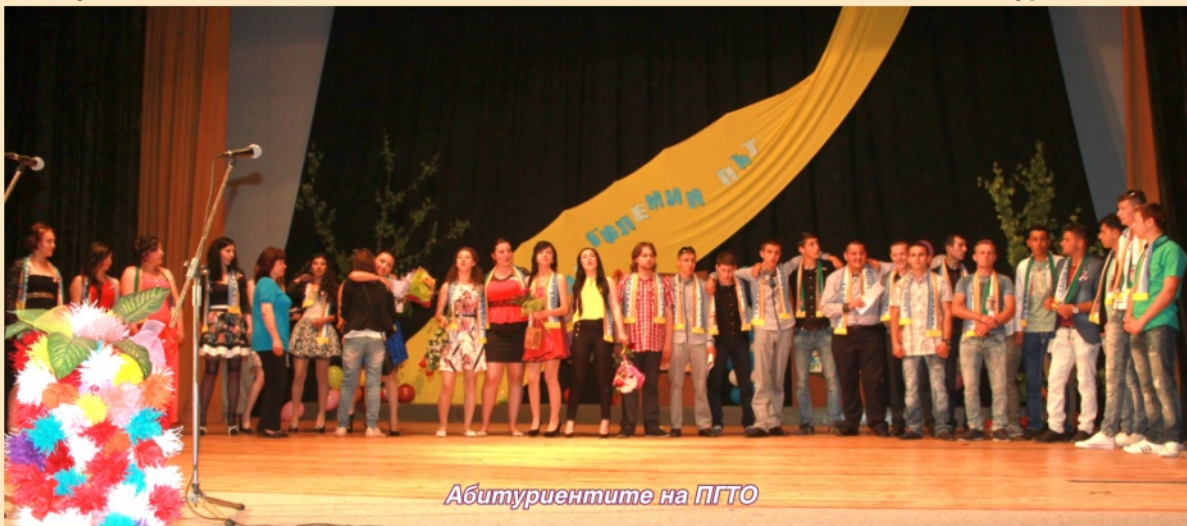
Абитуриентите на ПГТО

На 15 май ПГТО "Дочо Михайлов" изпрати випуск от 35-тима млади