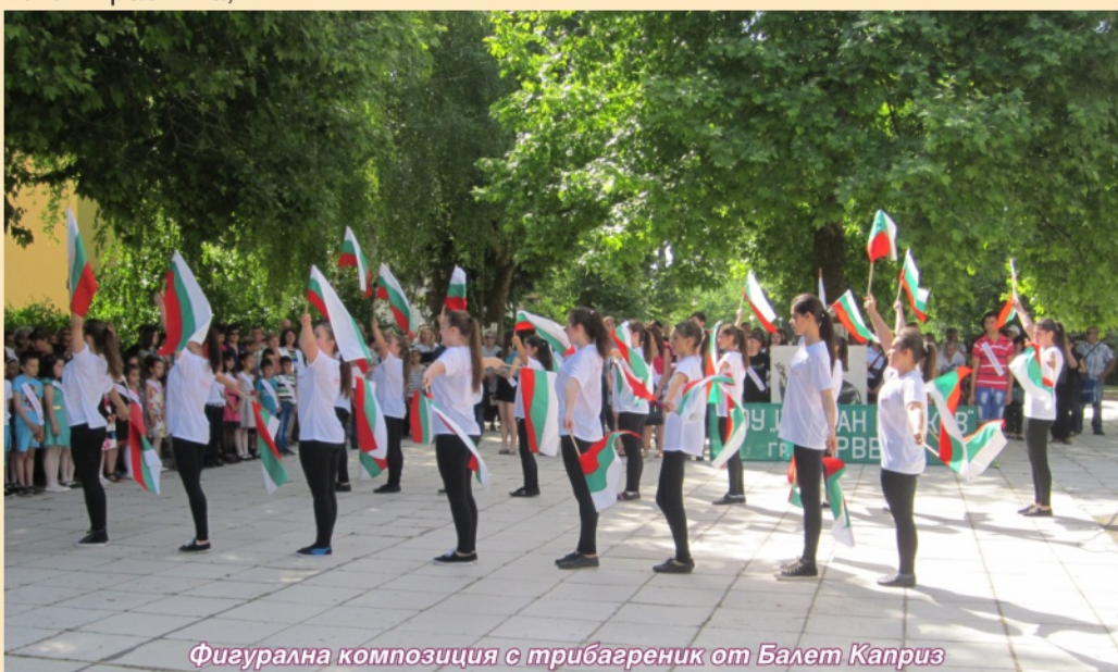
Фигурална композиция с трибагреник от Балет Каприз