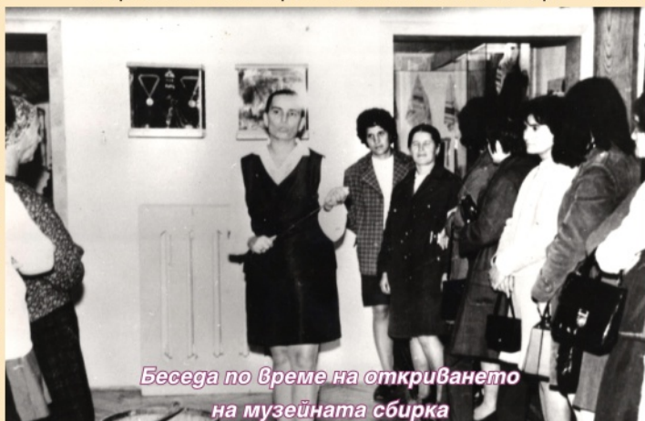
Беседа по време на откриването на музейната сбирка

химическата и тежката промишлености - текстилен цех в с.Орляк, керамичен цех в с.Безмер, плетачен цех в с.Коларци, цех за мергелна вата край с.Каблешково и др.