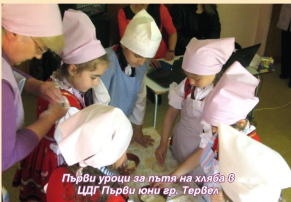
Първи уроци за пътя на хляба в ЦДГ Първи юни гр. Тервел