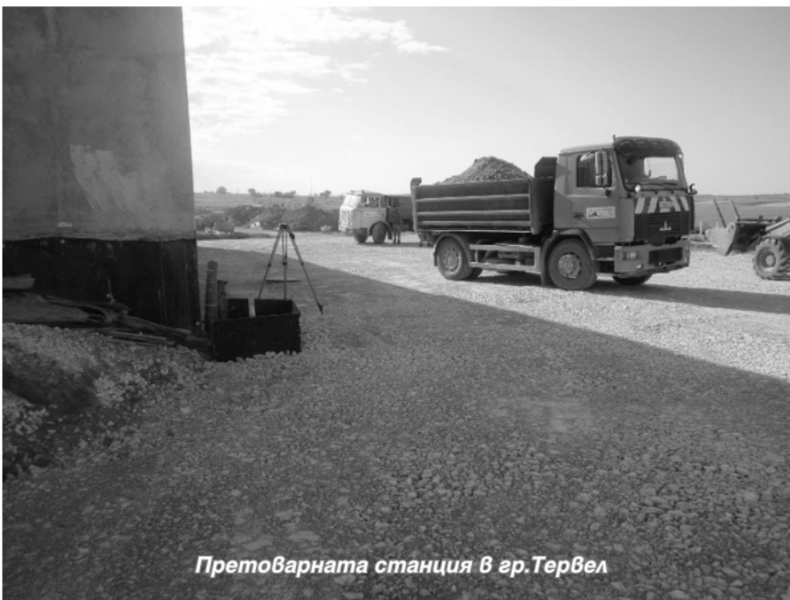
Претоварната станция в гр.Тервел

пътната ѝ настилка. Финансира се с общински проект по ПРСР на стойност 45 х.лв. без ДДС.