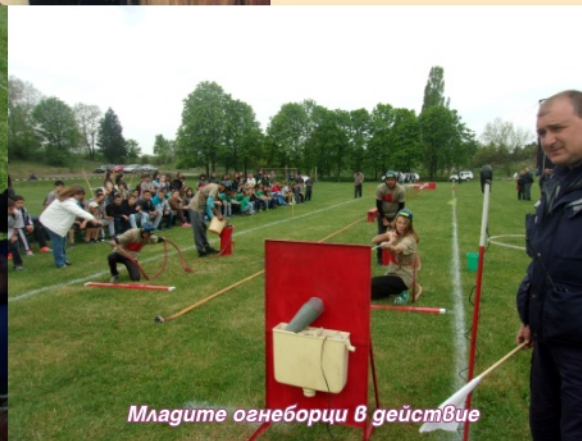
Младите огнеборци в действие

здравеопазване през 2010 година и работи по нея вече пет години. Целта на начинанието е да се компенсира липсата на последователна и работеща национална стратегия по отношение на