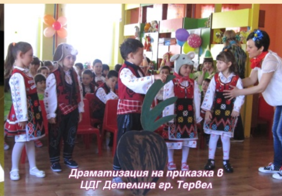
Драматизация на приказка в ЦДГ Детелина гр. Тервел