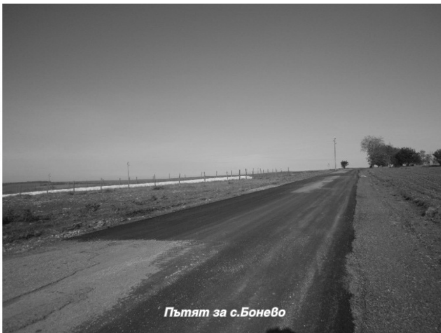
Пътят за с.Бонево

- През месец юни ще започне и основен ремонт на два участъка от общински пътища- Безмер-Мали Извор и Полк.Савово в регулация на селото.Финансирането е по капиталовата програма на общината.