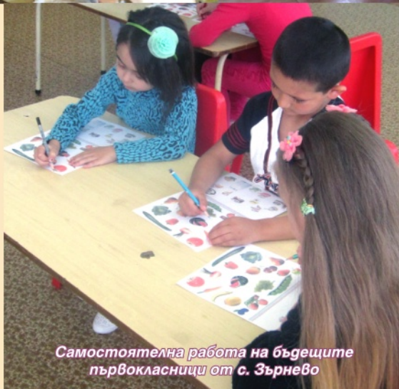
Самостоятелна работа на бъдещите първокласници от с. Зърнево