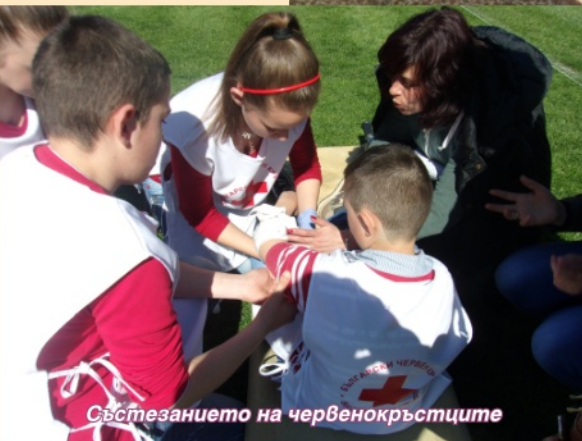
Състезанието на червеноръстците