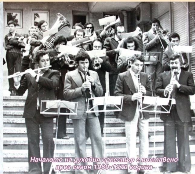
Началото на духовия оркестър е поставено през сезон 1969-1970 година