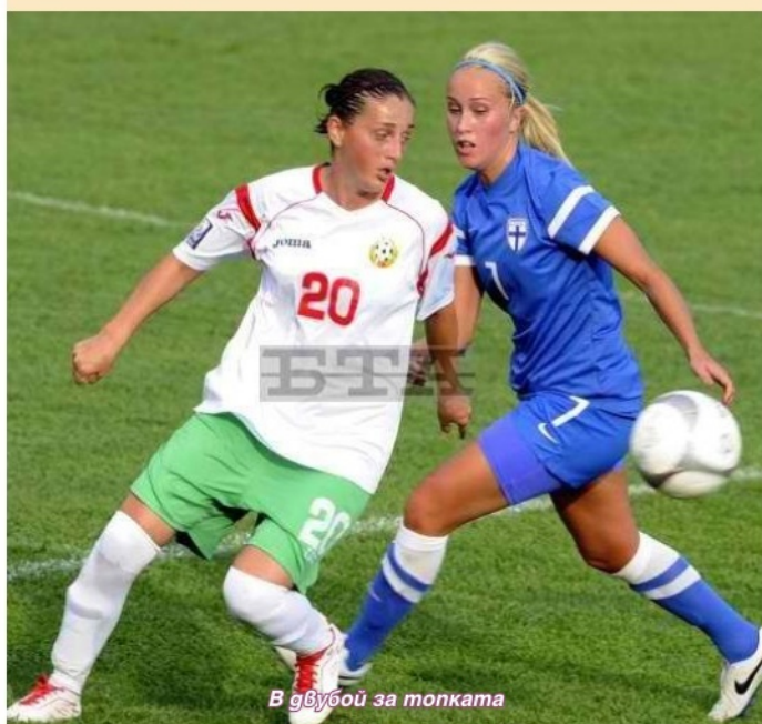
В двубой за топката