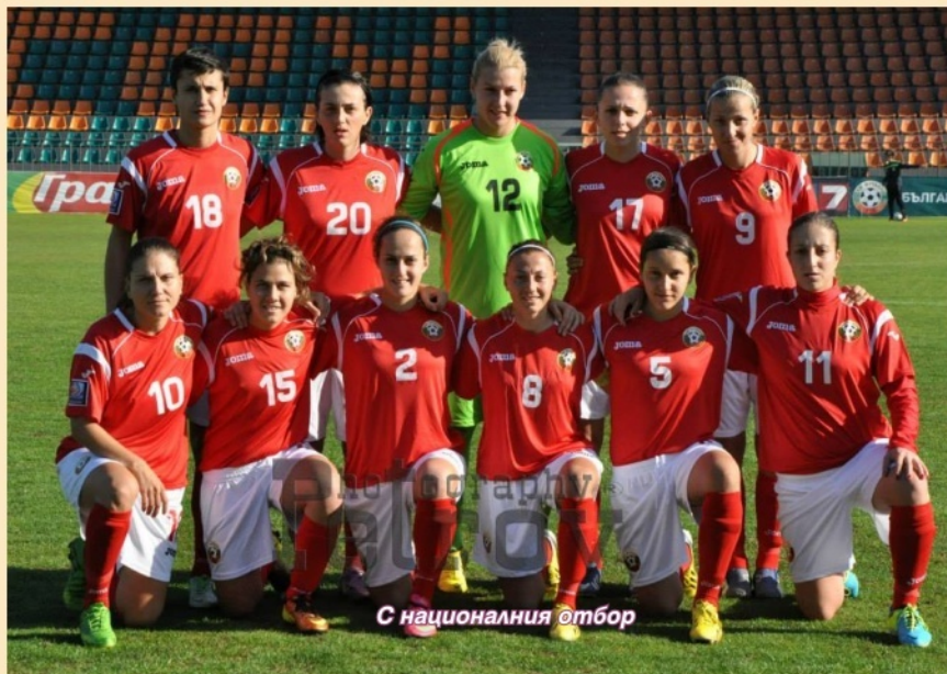
С националния отбор

- На първо място искам да пожелая на всички да бъдат живи и здрави, да бъдат горди, че живеят в този град, с това име, да се борят с тежкия живот, който е сега, и да не се предават. Това е най-лесното - да се предадеш, но ако си паднал и след това си победил, тази победа е най-сладката.