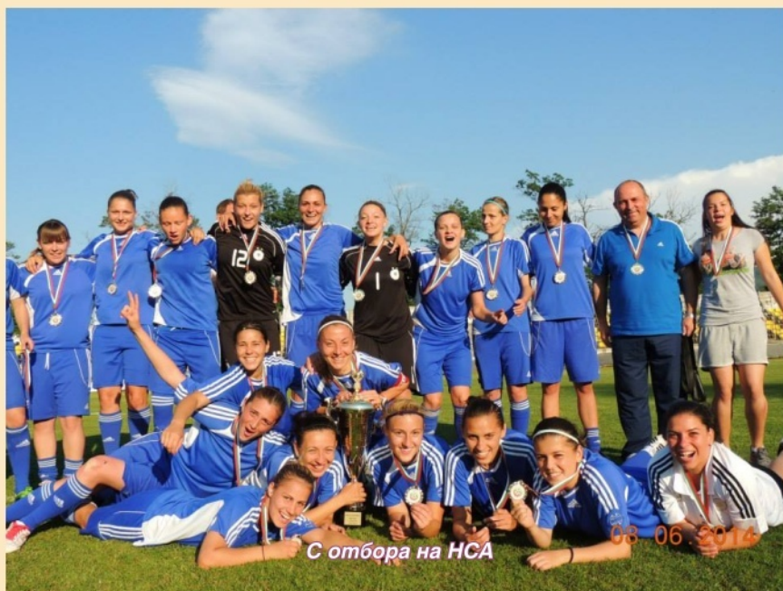
С отбора на НСА