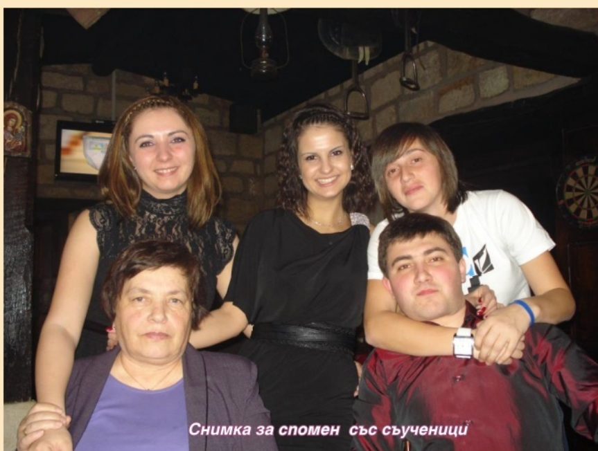
Снимка за спомен със съученици