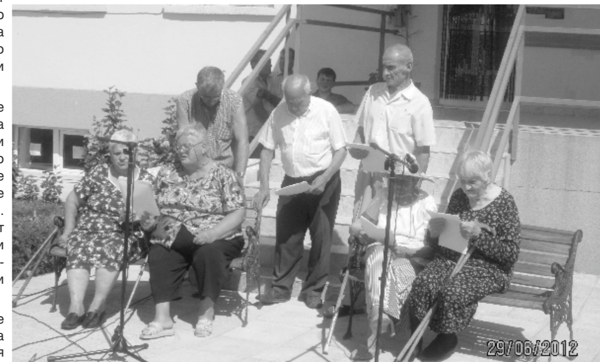
Участниците в юбилейната програма