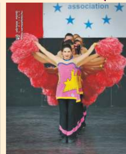
Танцът, който спечели престижния приз

Трудът на момичетата от Мажоретен Състав „Каприз“ при ОДК гр.Тервел бе увенчан с класирането им в призовата шестлица на международните и национални състезания - Първо място и купа Европа Гранд При 2012 г. в категория помпон, възрастова група сеньори.