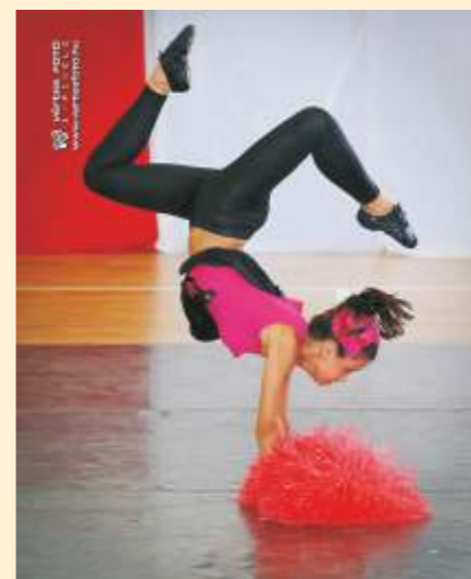
Акробатичните умения на мажоретките от Тервел са впечатляващи

Спортната надпревара беше оспорвана, защото след миналогодишното представяне в Хърватска, отново се срещнахме с водещите европейски отбори в мажоретните танци. Горещото и уморително време, 40-градусовите температури не сломиха спортния дух и желанието за достойно представяне на трите български отбора.