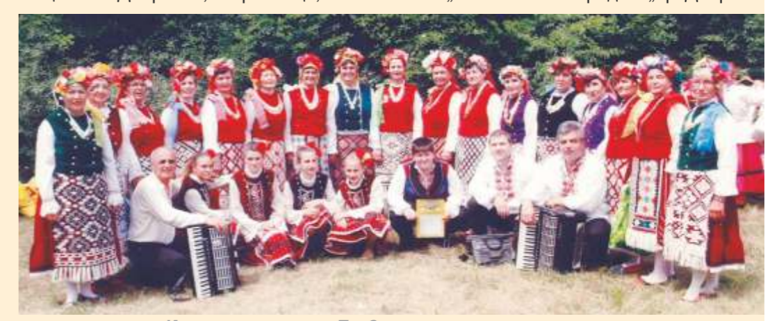
Изпълнителите от Тервел с наградите от конкурса