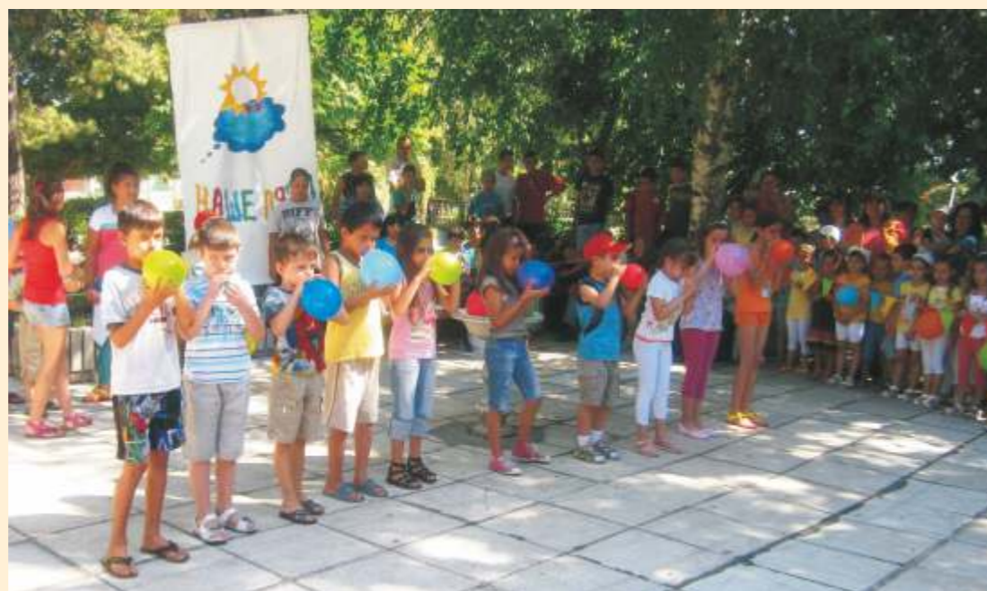
Наше лято започна с весели игри.

ЗАПОВЯДАЙТЕ! ОЧАКВАТ ВИ МНОГО ИГРИ, НАГРАДИ И ИЗНЕНАДИ!