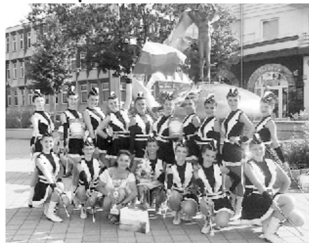
Носителите на Гран при за 2012 година