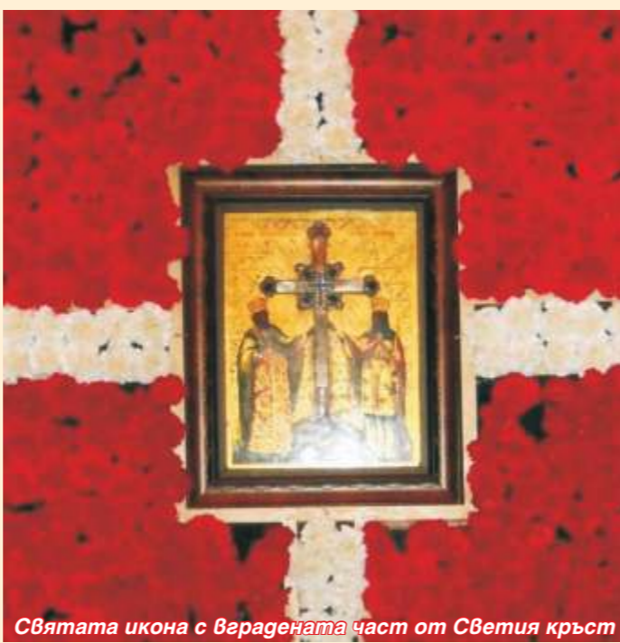
Святата икона с вградената част от Светия кръст

миряните в храма "Св. Георги" в Тервел само за 2 часа. Това прекрасно събитие е реализирано по молба на Негово Високопреосвещенство Доростолски митрополит Амвросий със съгласието на Негово Светейшество патриарх Максим. Разрешението беше дадено от Негово Блаженство Теофил Трети, патриарх на светата земя Йерусалим и цяла Палестина. Светинята посети също градовете Несебър, Алфатар, Велико Търново, Монтана и Видин. Официално тя пристигна в България на 26 юни и отпътува на 5 юли.