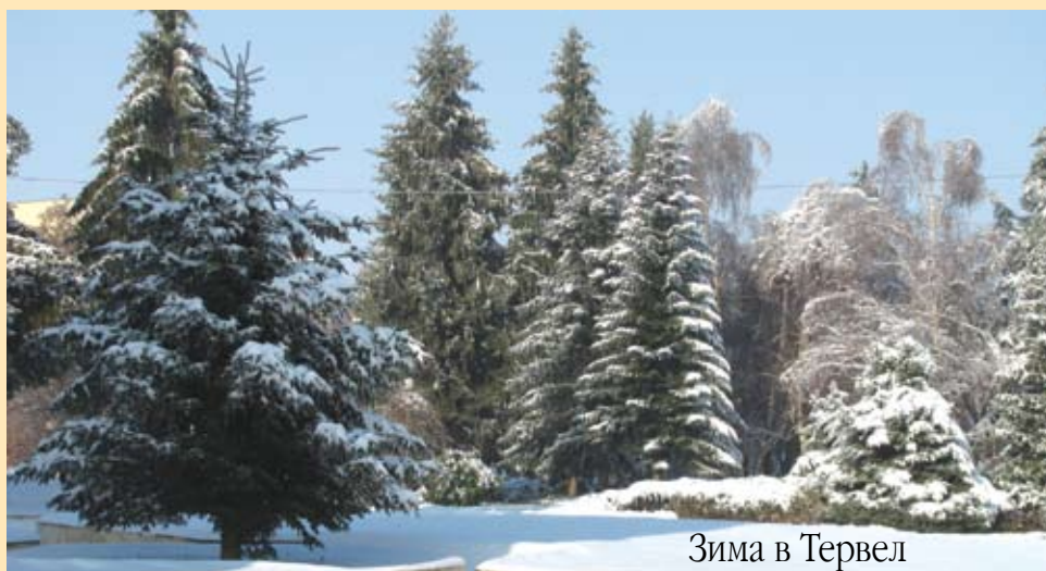
Зима в Тервел