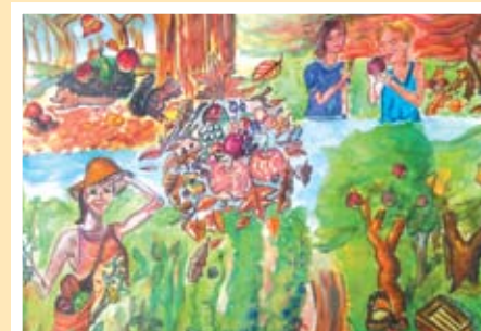
Рисунката на Стелияна