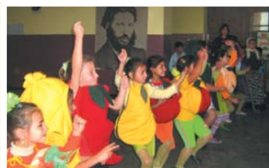
Децата в Орляк са умели танцьори

Накрая всички бяха поканени да се присъединят към кръшното българско хоро.