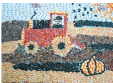
Мозайката на Димитър Здравков