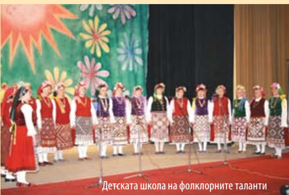
Детската школа на фолклорните таланти

Началото на концерта започна с представянето на Танцово - певческата група. На сцената се наредиха, като пъстра броеница талантивите жени, облечени в красивите алфатарски костюми, закичени с пъстри китки на главите. И когато запяха и заиграха, залата притихна в захлас и възхищение. След това се заредиха едно след друго изпълненията на талантивите деца, един букет от младост, талант и красота. И така непрекъснато се надпяваха младостта и опита, звъна на детските гласове и рутината и майсторството на по-старите.