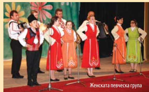
Женската певческа група