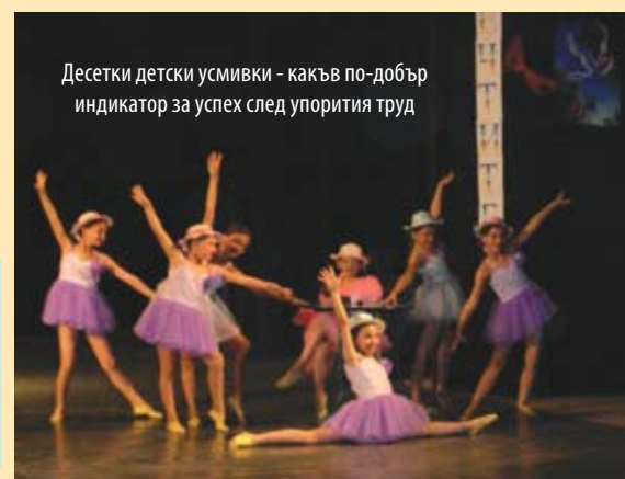
Десетки детски усмивки - какъв по-добър индикатор за успех след упорития труд