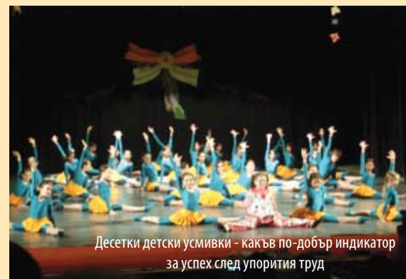
Десетки детски усмивки - какъв по-добър индикатор за успех след упорития труд