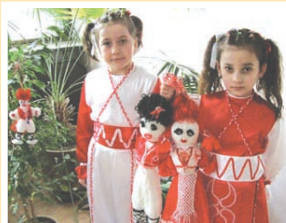
пожелания от 4 мартенички