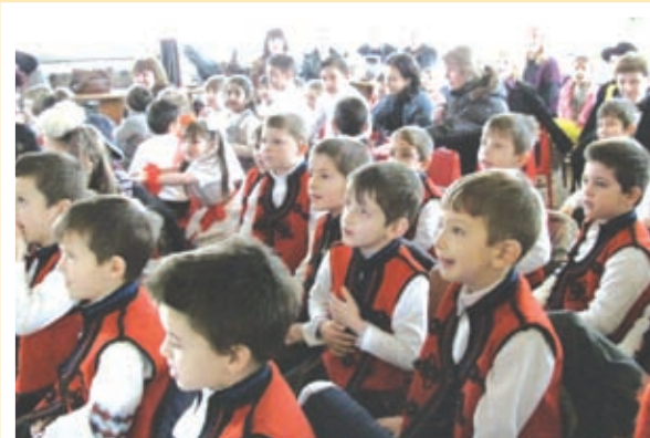
много гости на Баба Марта

познатите Пижо и Пенда. Мартениците, които носят като дар са изработени с много умение и желание. Бузките на дечицата са червени като мартеничките, личицата им сияят, очите им са чисти и общуването с тях зарежда с енергия