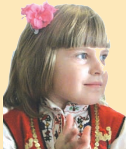
и най-малките участници се вълнуват на първомартенския празник

Освен посрещането на Баба Марта, първият ден на месец март е празник и за една категория хора, които наричаме с името „самодейци“.