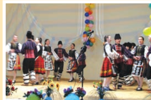
детският ансамбъл от Тервел гостува в с.Нова Камена

деца от местното средишно училище. Центърът ще предлага възможности за занимания и на гостуващи в селото деца през лятната ваканция.