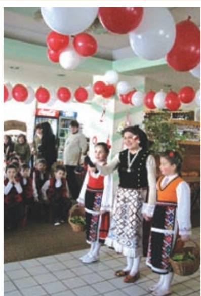
Баба Марта и внучките ѝ