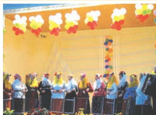
Женска певческа група от село Нова Камена

Работата на центъра ще започне непосредствено след пролетната ваканция и първият ѝ етап ще приключи в края на учебната година. В нея ще участват