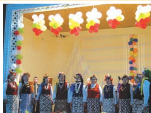
Женската певческа група от Тервел в село Нова Камена

разгледаха помещенията на центъра – ателие по керамика и приложно изкуство, библиотека с читалня и зала за прояви. „Гвоздеят“ на програмата бе концертът, подготвен и представен на обновената читалищна сцена от самодейци от читалищата в Тервел и Нова Камена. Две женски певчески групи / Тервел и Нова Камена / и детската школа за народно пеене от Тервел развълнуваха хората в залата с типични за селото и района любими народни песни и мелодии.