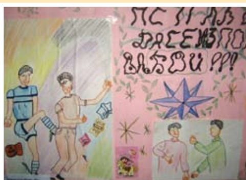
колаж на Джансун Ахмед Шукри, възпитаничка на ШИПИ към ОДК Малкият принц гр. Тервел – III м.

В мероприятиято взеха участие 22 деца на възраст 12-18 години, 11 от които възпитаници на Школата по изобразително и приложно изкуство (ШИПИ) към ОДК „Малкият принц“ гр. Тервел и 11 ученици от ОУ „Васил Друмев“ с. Орляк.