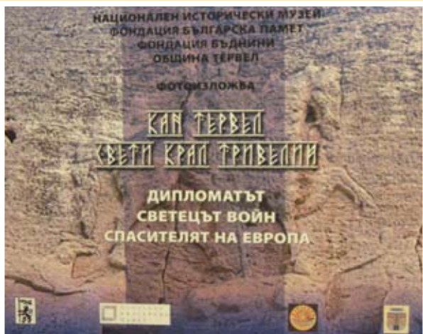
Заглавно пано на фотоизложбата в Националния исторически музей

Фотоизложбата е подготвена от две фондации – „Българска