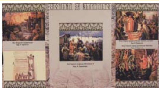
Мозайка от факти, изобразени в картини - Величието на средновековна България

Друго негово ценно качество, подчертано от авторите на изложбата е умениято му да бъде дипломат. През 705 година той, използвайки умело за каузата на България междуособиците във Византийския императорски двор, успява по мирен път да присъедини към територията на страната си областта Загоре, включваща днешното Южно Черноморие, Бургаска, Сливенска и Ямболска област.