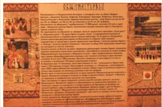
Името на Кан Тервел - Община Тервел днес

с признание делото на българския Кан, канонизиран от Западната църква като Свети Крал Тривелий. Паисий Хилендарски го представя в своята история славянобългарска като „Свети Крал Тривелия”, наречен монах – Теоктист”. Знае се със сигурност, че след оттеглянето си от престола Тервел става монах.