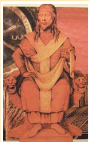
Предполагаме вид на статуя на Кан Тервел, стояла в Златната църква в Константинопол

Фотоизложбата всъщност предлага синтезиран и атрактивен за разнообразна аудитория прочит на житието на един от безспорно най-великите български владетели. Тя акцентира върху малко известни неоспорими исторически факти от една страна, а от друга – подчертава значимостта на Българския Кан и респективно на България за Стария континент и християнството.