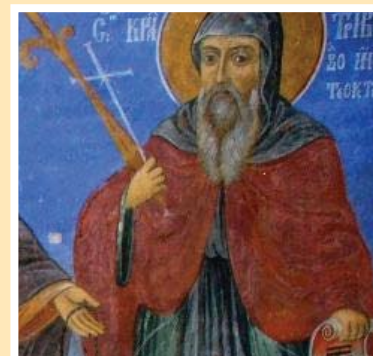
Свети Крал Тривелий - стенописи от църквата в Старо село

Фотоизложбата ще бъде подредена в сградата на Община Тервел през месец Май тази година. Откриването ѝ ще бъде част от поредица от прояви, посветени на Кан Тервел и съвремението на Община Тервел.