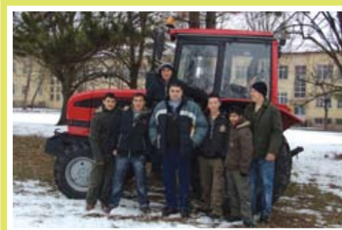
Нова придобивка за ПГТО- доставения по проект, финансиран от МОН трактор

Организаторите връчиха предметни награди и грамоти на всички участници.