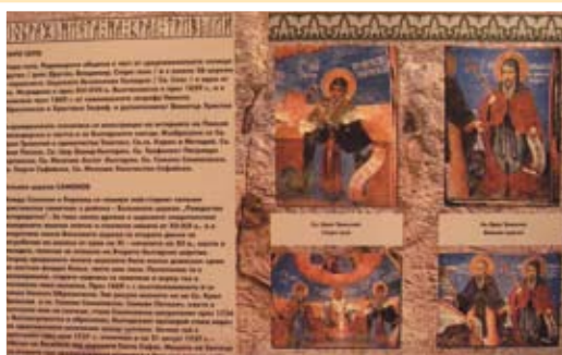
Изображения на Светеца Крал Тривелий в средновековни български църкви