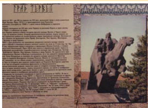
Паметник на владетеля в града, носещ неговото име