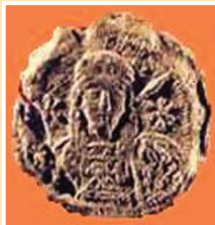
Печатът на Кан Тервел

Тервел, управлявал България от 701 до 718 година остава в историята като Войн (през 708 година край Поморие той разбива византийската армия), като Светец (ревностен християнин, приел монашеството под името Теоктист (като Спасител на Европа) единствения средновековен пълководец, разбил 100 хилядна арабска армия и предотвратил ислямизирането на Европа).