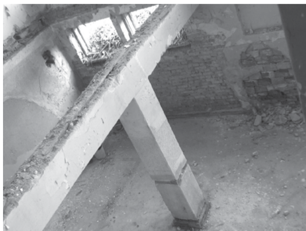
бившето общежитие преди ремонта по проекта