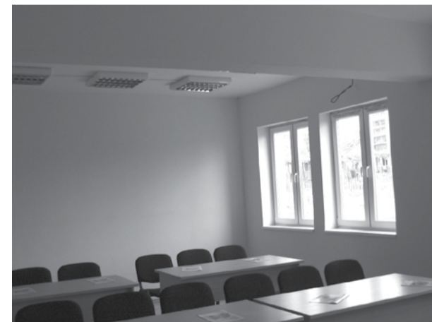
същото място след ремонта по проекта

Общият бюджет на проекта възлиза на 146 378 евро.109 783.50 евро се осигуряват от грантовата схема, а съфинансирането в размер на 36 594.50 евро се осигурява от Община Тервел.