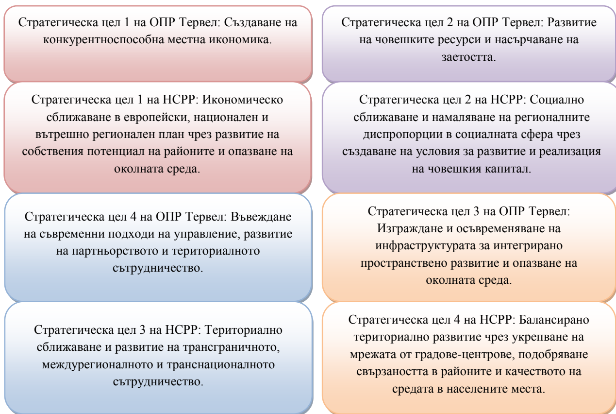
Фигура 4: Съответствие на ОПР на община Тервел с Национална стратегия за регионално развитие 2012-2022 г.

Връзка с НСРР 2012-2022 г. е налице по всички стратегически цели, т.е. оценителят може да твърди, че е установено съответствие на изведените в НСРР и ОПР на община Тервел стратегически цели.